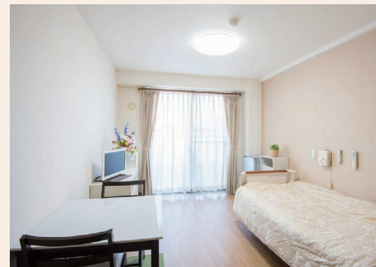
自分らしくのびのびと過ごせる居室

プライバシーが守られるように、個室を基本としています。自分の時間を持つことで、心のゆとりや自発性、自立度の向上へとつながります。リビングやダイニングなどの共有スペースは、広々として明るく、開放的な雰囲気です。ご入居者さま同士はもちろん、ご家族さまや来訪されたご友人とゆっくりご歓談いただけます。