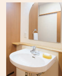
車椅子でも使いやすい洗面台

※居室内の設備・配置および居間の広さ・形は、ホームによって異なる場合がございます。詳しくは、介護なんでも相談室までお問い合わせください。