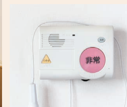
緊急通報装置もあって安心