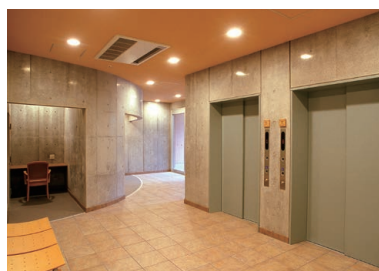
エレベーターホール(B1F)