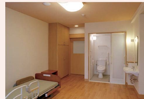
自分らしくのびのびと過ごせる居室

ご自宅で過ごすのと同じような環境づくりを大切にしたい個室仕様の“住まい”が、これまでと変わらないありのままに暮らす日々を叶えます。