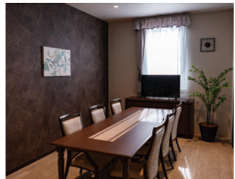
ファミリーダイニング