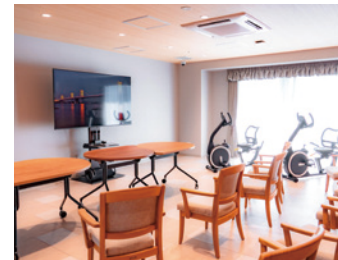
コミュニティルーム