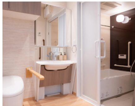
手すりが設置され使いやすいトイレ・浴室