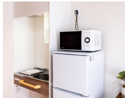
使い勝手の良いミニキッチン