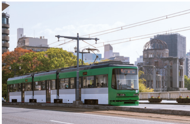
広島市内を走る広電