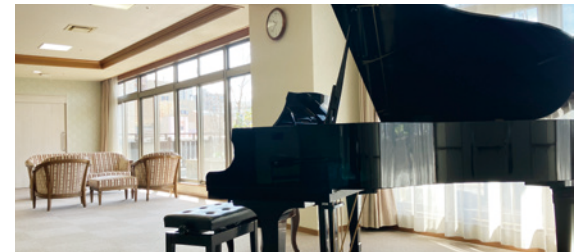
開放感あふれる共用スペース