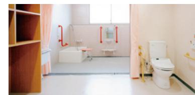
プライバシーが配慮された個浴