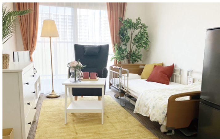
お気に入りの家具を持ち込める居室

ご入居者の皆さまのプライバシーに十分配慮しながら、 専用のトイレ、エアコン、洗面台、電動ベッドが整っています。 緊急コールによって健康状態の変化に迅速に対応する 安心の介護を実現します。