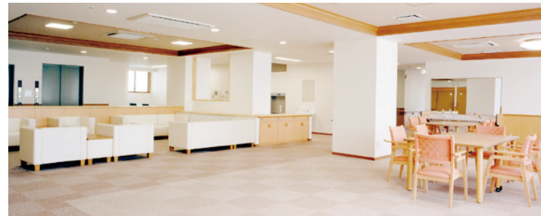
大きな窓から陽光が差し込む明るさいっぱいの食堂・デイルーム

デイルームは、主に「居間」と「食堂」の役割を果たします。ご入居者の皆さま同士、またご家族で楽しくお過ごしてください。 6階南側の屋上テラスでは、広さ189㎡のバリアフリーとなっており、車椅子の方でもゆっくりと楽しんでいただけます。