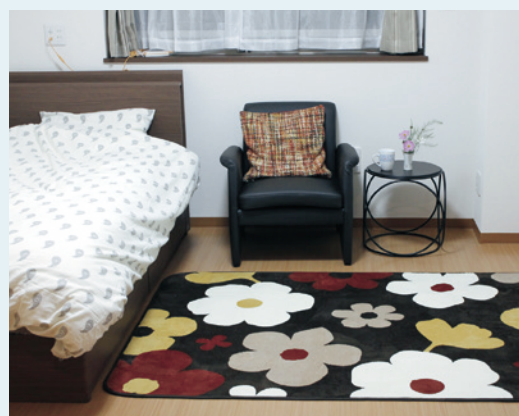
お好みの家具を持ち込むことができる住空間

お気に入りの家具や使い慣れた電化製品を持ち込んでいただき、ご自分らしいインテリアで楽しんでいただける居室。