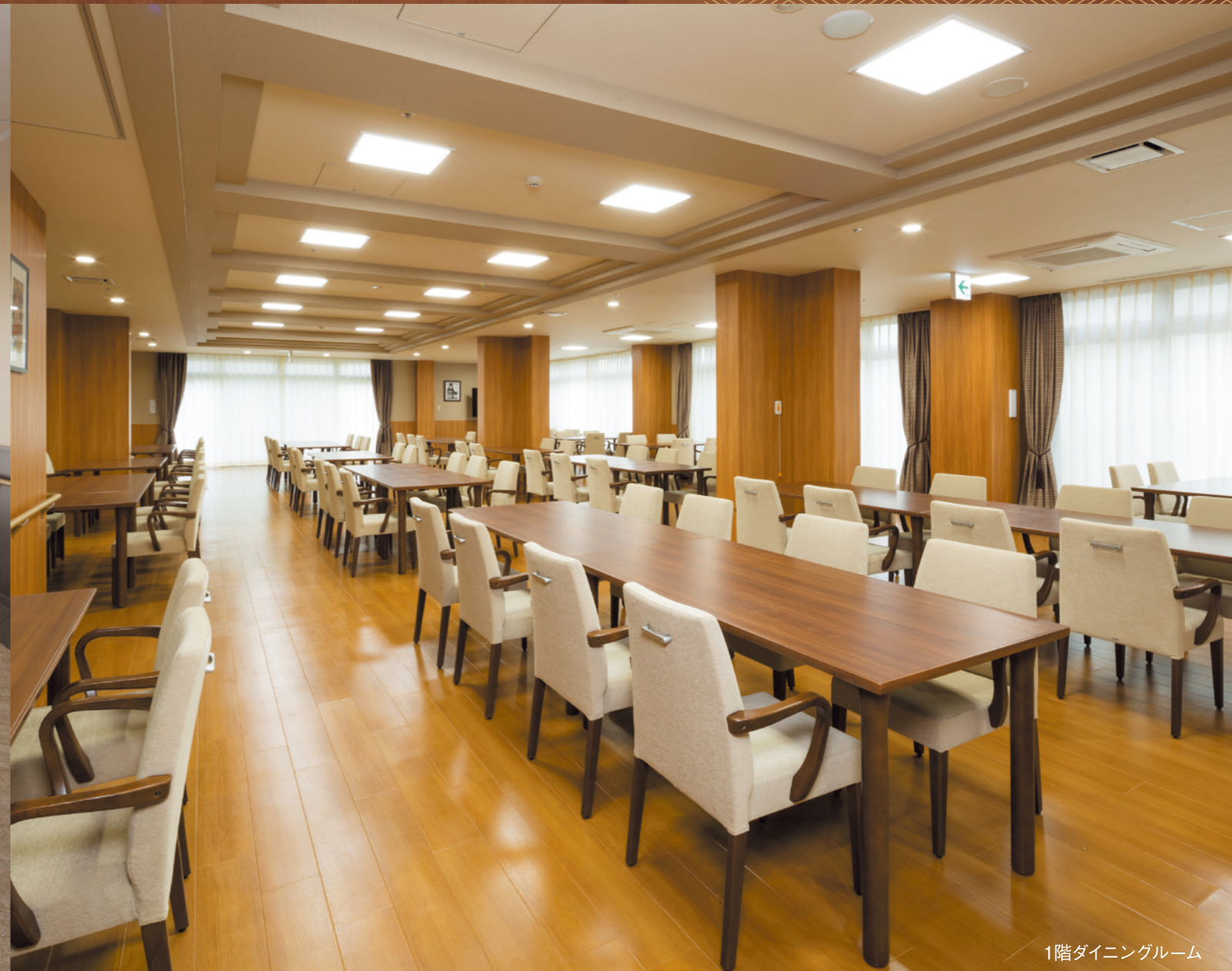
1階ダイニングルーム