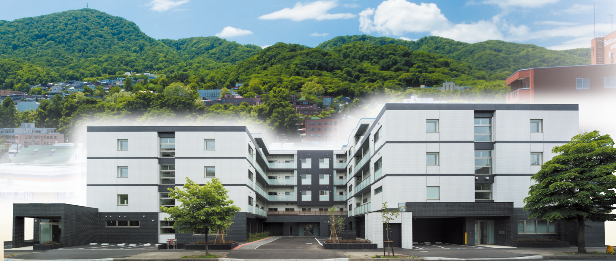
※上記の建物写真はラヴィーレジデンス旭ヶ丘の外観写真（平成29年6月撮影）にCG処理を施したものです。

一人暮らしが不安な方、介護・看護の必要な方。 終身ご入居いただくことが可能です。