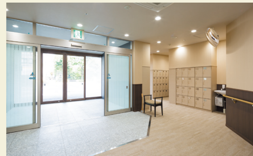
※このパンフレットに掲載している本施設の写真は平成29年6月に撮影したものです。

日々の健康についての相談や何げない会話など、いつでも気軽に立ち寄れる安心のサービスステーションです。