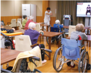
参考：ラヴィーレジデンス旭ヶ丘で行われた介護予防運動(一例)

スタッフによる介護度進行を予防するグループリハビリを導入。車いすの方でも参加していただける体操やゴムバンドを使ったセラバンド体操などを通じて、健康維持と、より質の高い生活のためのサポートにも積極的に取り組んでいます。