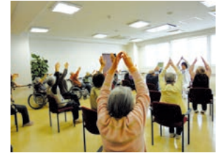
参考：ラヴィーレレジデンス北大前で 行われた介護予防運動（一例）

スタッフによる介護度進行を予防するグループリハビリを導入。車いすの方でも参加していただける体操やゴムバンドを使ったセラバンド体操などを通じて、健康維持と、より質の高い生活のためのサポートにも積極的に取り組んでいます。