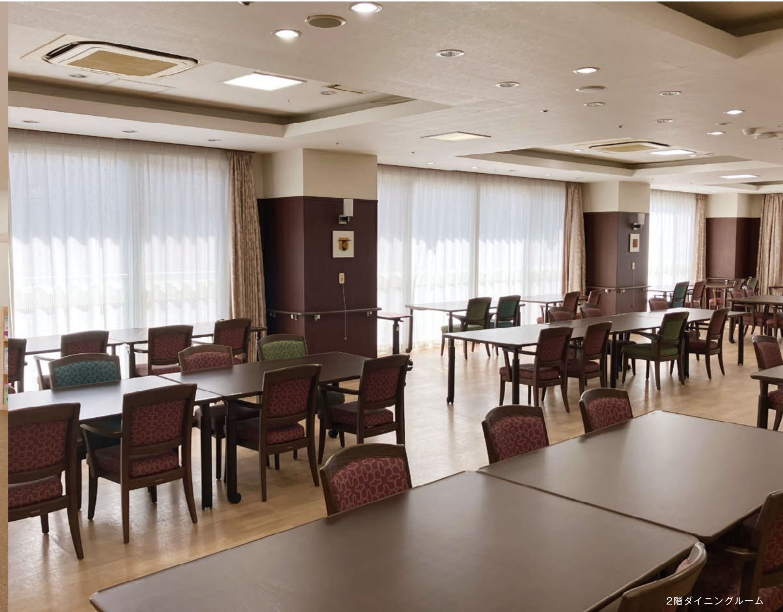
2階ダイニングルーム