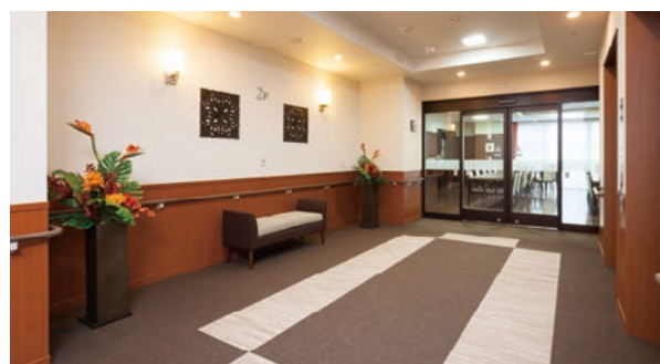
2階エレベーターホール

ご入居者様はもちろん、ご家族様やお友達をお招きして、くつろいでいただけるスペースをご用意いたしました。ご入居者様同士のコミュニケーションの場としてもお役に立てるものと思います。