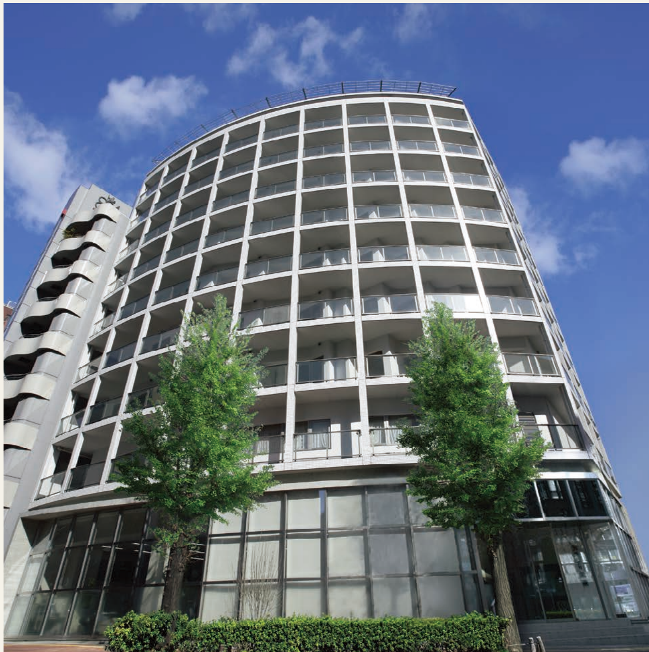
写真は平成18年2月に撮影されたラヴィーレ本郷外観にCG処理をしたものです。