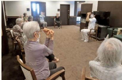
理学療法士(PT)による「リハビリ体操」の様子 (令和3年5月撮影)