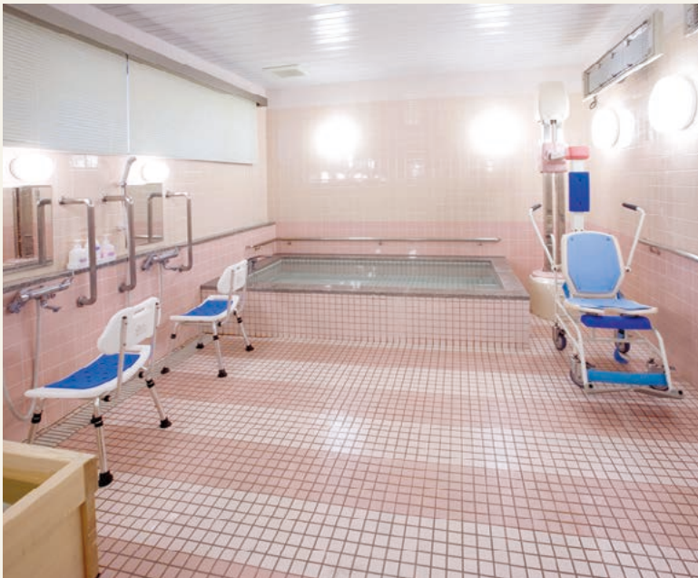
機械浴室・浴室 寝たままの状態でもご入浴できる機械浴と車いす対応のリフト設備を完備した浴室です。お身体に負担をかけずに安心してご入浴をお楽しみいただけます。