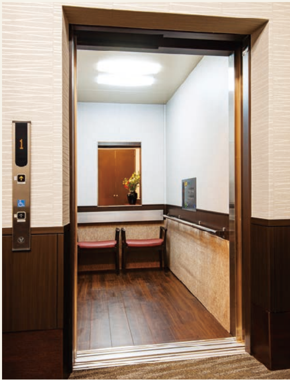
ストレッチャー対応型エレベーター (令和3年4月撮影)

エレベーターは2基設置。うち1基はストレッチャーが入るワイドタイプを採用しています。