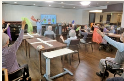
音楽健康指導士による「オリジナル体操」の様子 (令和3年5月撮影)