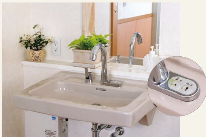
洗面ユニット(平成18年2月撮影)

ニー(膝)スペースを確保した車いす対応の使い勝手のよい洗面台です。ボタンでも手をかざすだけでも水が出る水栓機能がとても便利です。給湯機能もございます。