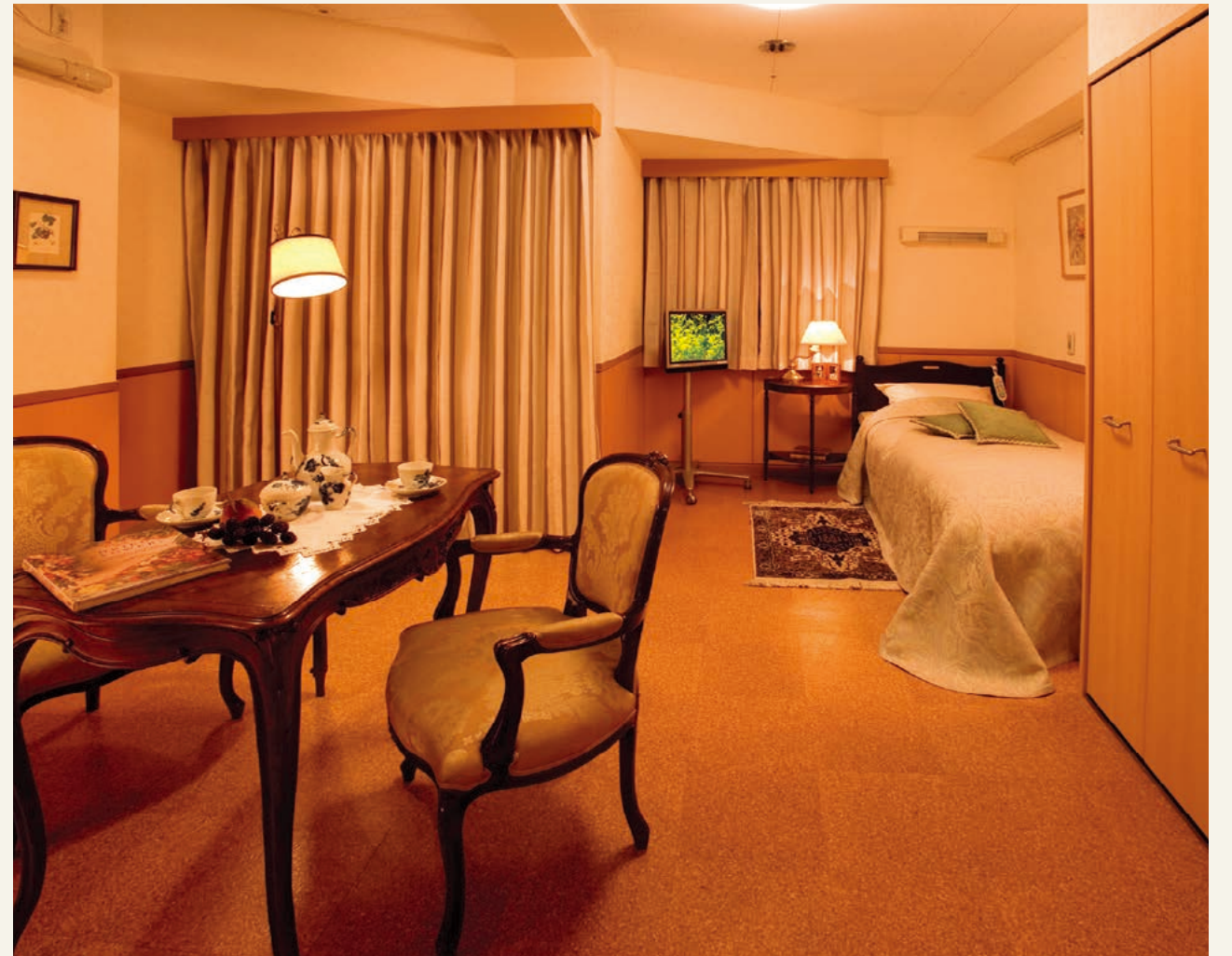
居室(平成18年2月撮影)