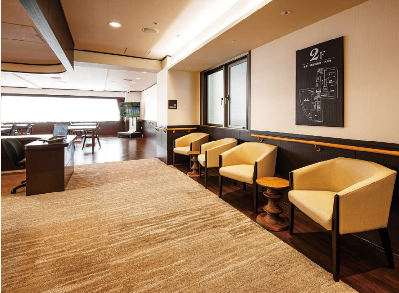
大ホール(令和3年4月撮影)