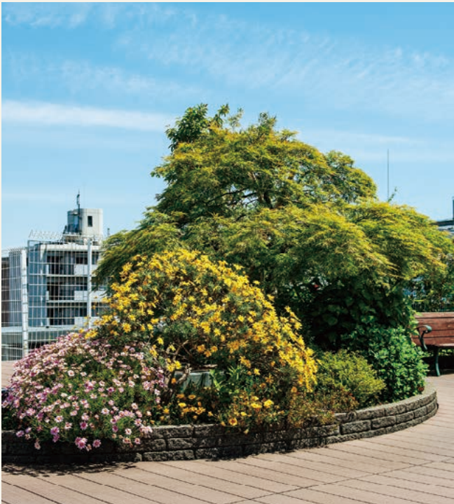
植栽 (令和3年4月撮影)