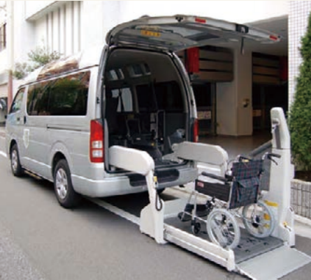
福祉車両(参考写真)

協力医療機関への送迎や入院中の肌着、寝巻き、タオルなどの洗濯物のお届けなど、様々なサポートを行う福祉車両(車いす対応)を二台ご用意しています。