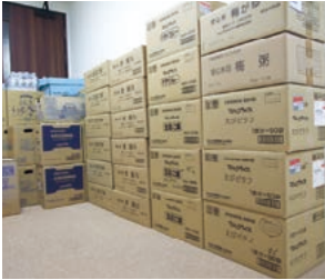
ラヴィーレジデンス・備蓄品(参考写真)

火災報知器が働くとエレベーターは避難階まで直行しドアを開けた後、休止状態となります。