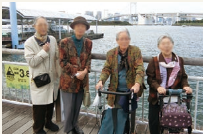
「ドライブツアー」の様子(令和2年10月撮影)