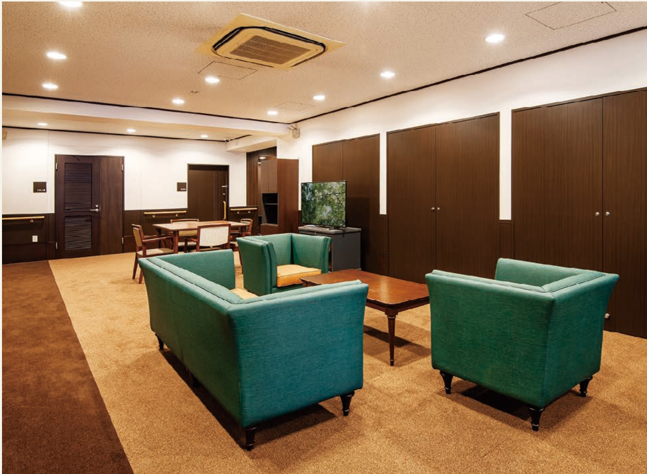
ラウンジ(食堂・談話スペース) 7階ラウンジ(令和3年4月撮影)

居室のある各フロアに設けたラウンジはご入居様が気楽にお立ち寄りになりお食事やティータイム、語らいのひと時をお過ごしいただくスペースです。どうぞご家族やご友人をお招きください。