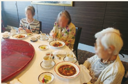
「外食の会」の様子(令和元年12月撮影)