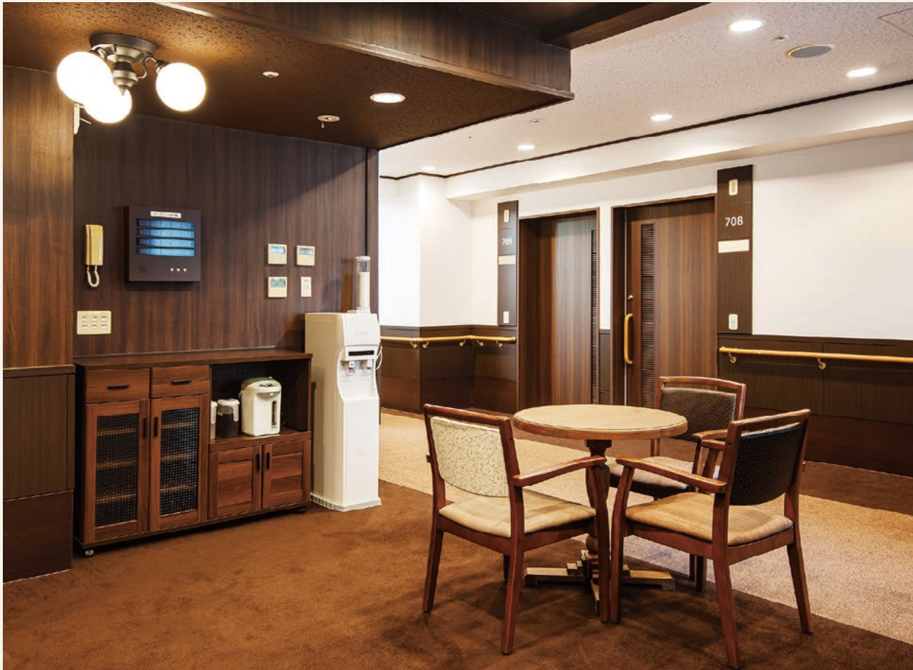
喫茶スペース 7階喫茶スペース(令和3年4月撮影)

スタッフへのご相談がある際に気軽にご利用いただけます。また、ご入居者様やご家族様がくつろぎながらお話しもできるスペースです。