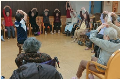
専門トレーナーによる「健康いす体操」の様子 (令和2年8月撮影)

ご入居者様がいつまでも活力に溢れた毎日を送れるよう、大手のスポーツクラブと契約し専門トレーナーによる介護度進行予防の運動プログラムを導入。健康維持と、より質の高い生活を送るためのサポートに積極的に取り組んでいます。