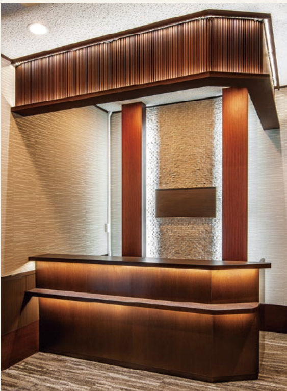
1階フロント (令和3年4月撮影)