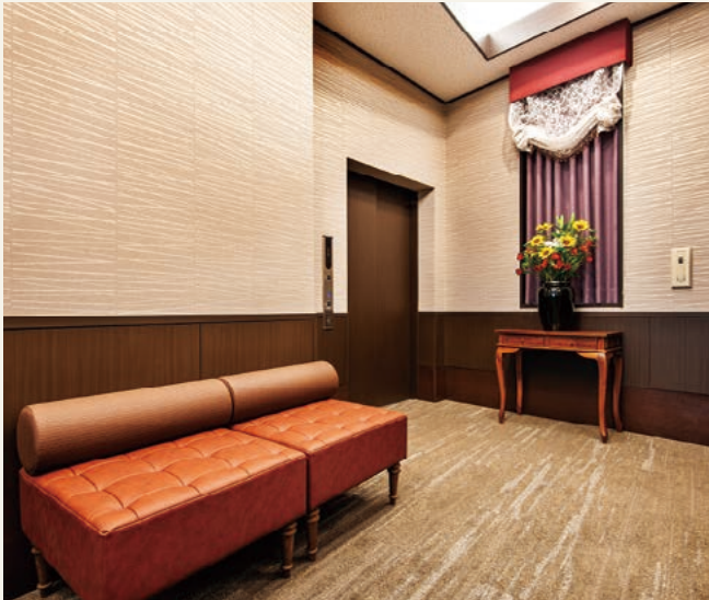
1階エレベーターホール (令和3年4月撮影)