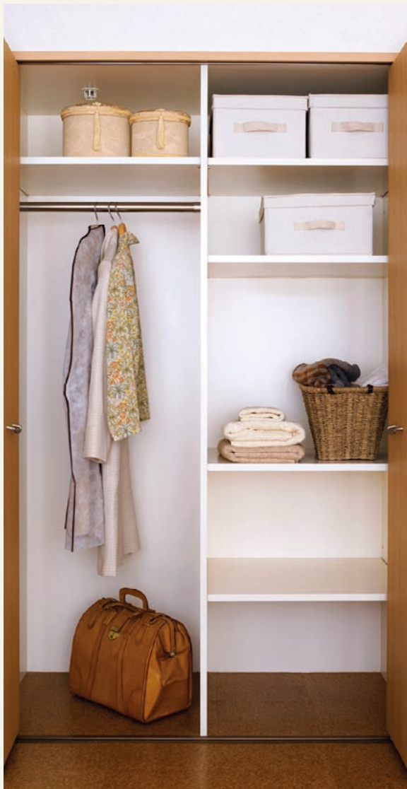
クローゼット(平成18年2月撮影)