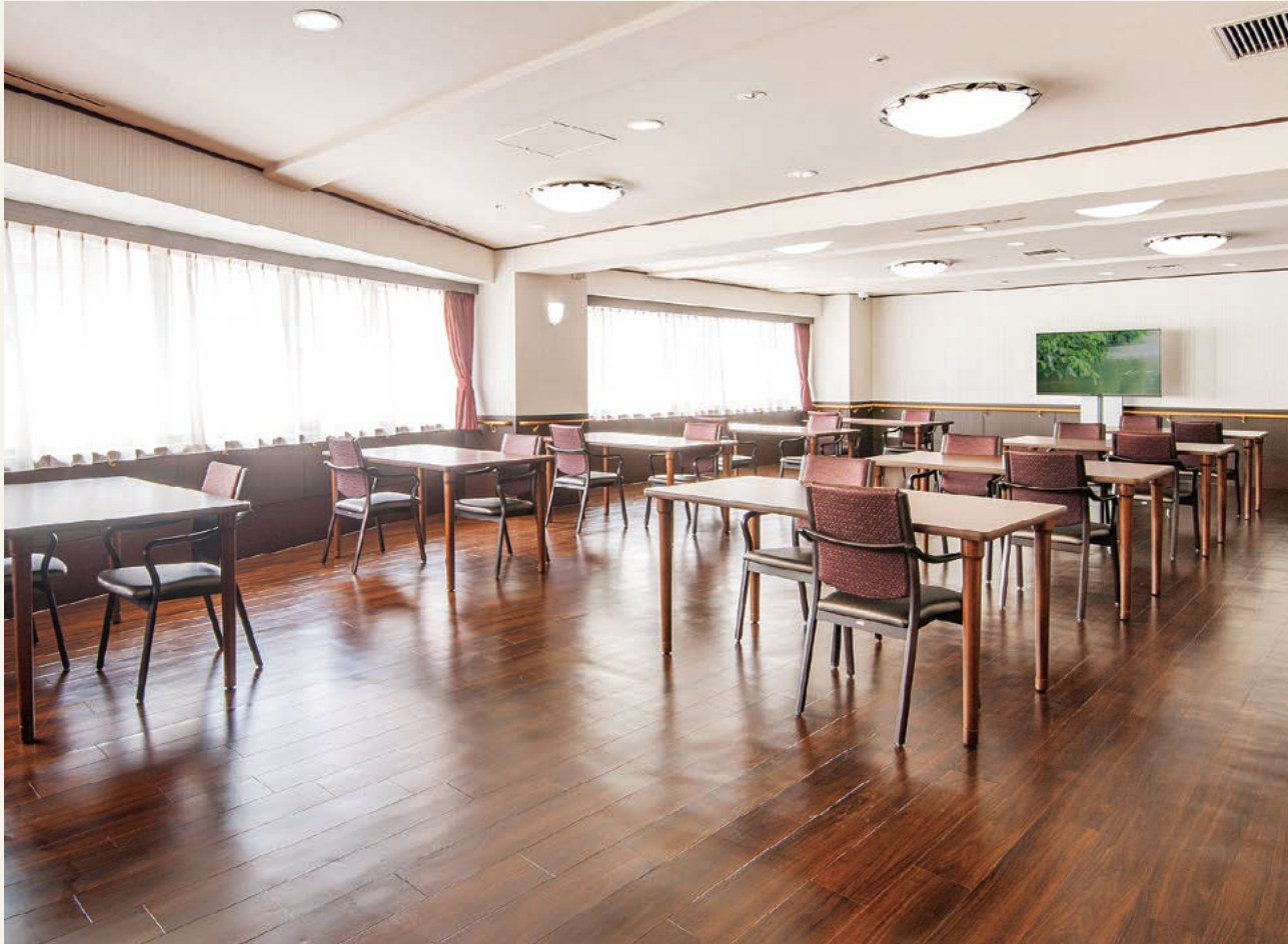
大ホール(食堂・機能訓練室) お食事や各種レクリエーション、機能回復訓練などにお使いいただく2階大ホールです。ソファでくつろぎながらティータイムなどもお楽しみいただけます。