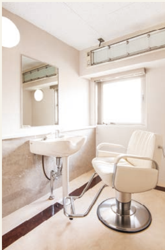
理美容室(令和3年4月撮影)

毎日の生活を、より輝いてお過ごしいただけるよう、訪問理美容によるヘアカットやヘアセットのためのお部屋を6階にご用意しています。