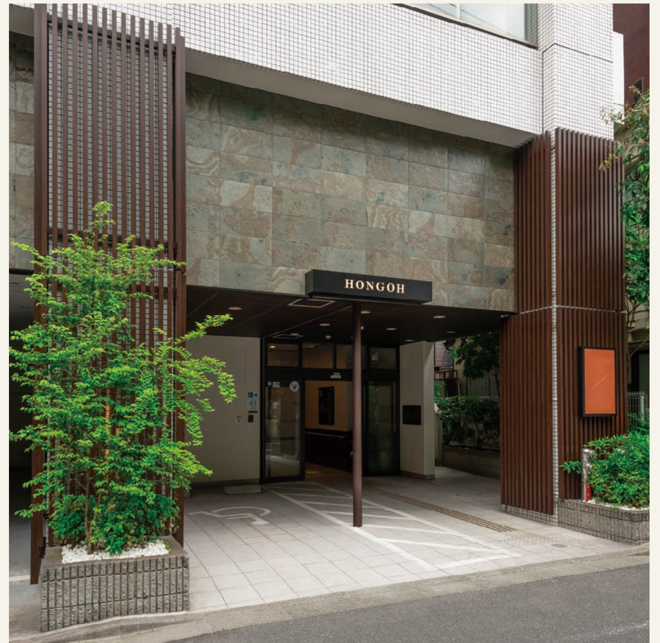
エントランス(令和3年5月撮影)