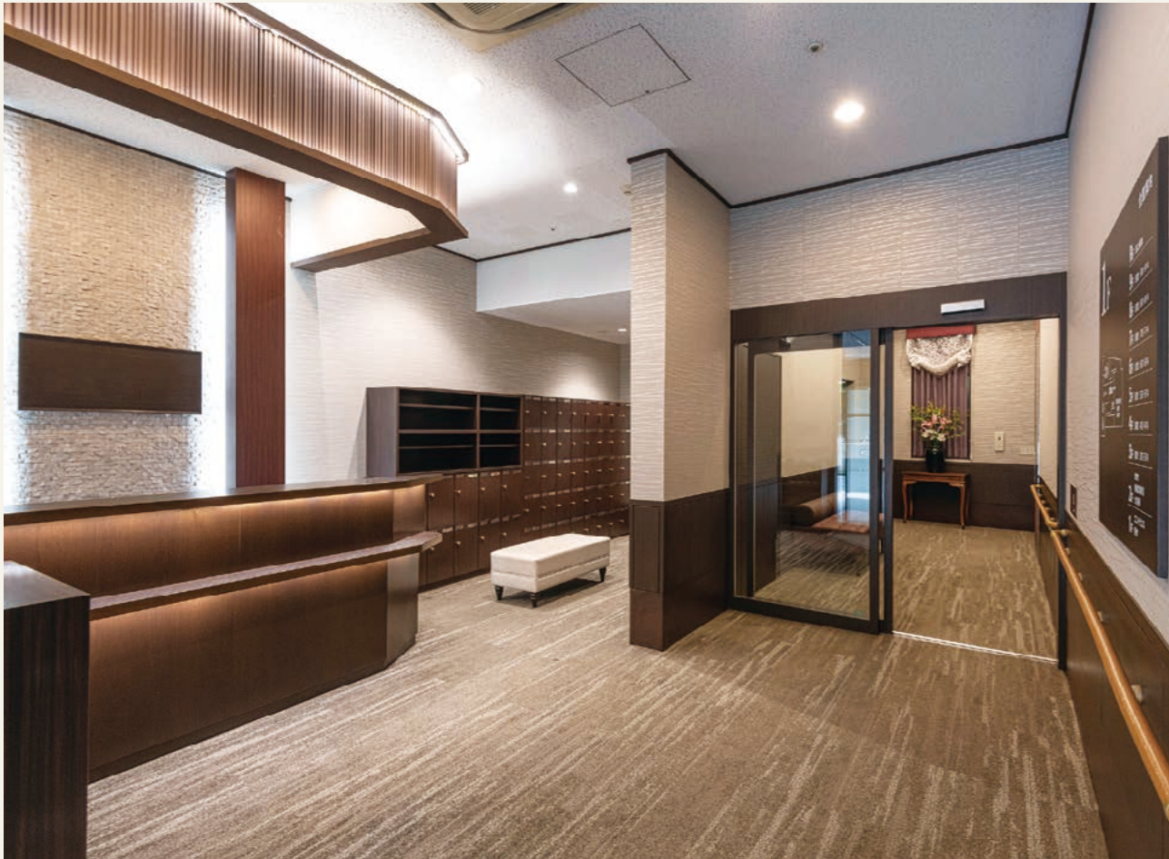
1階エントランス (令和3年5月撮影)

エレベーターは2基設置。うち1基はストレッチャーが入るワイドタイプを採用しています。