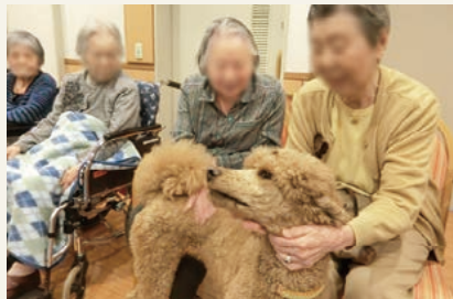
「ドッグセラピー」の様子(令和元年12月撮影)