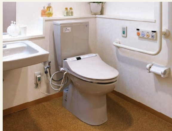
多機能トイレ(平成18年2月撮影)

快適な暖房・脱臭機能付温水洗浄トイレを完備。入口はスライド式で車いすでも出入りしやすい設計です。