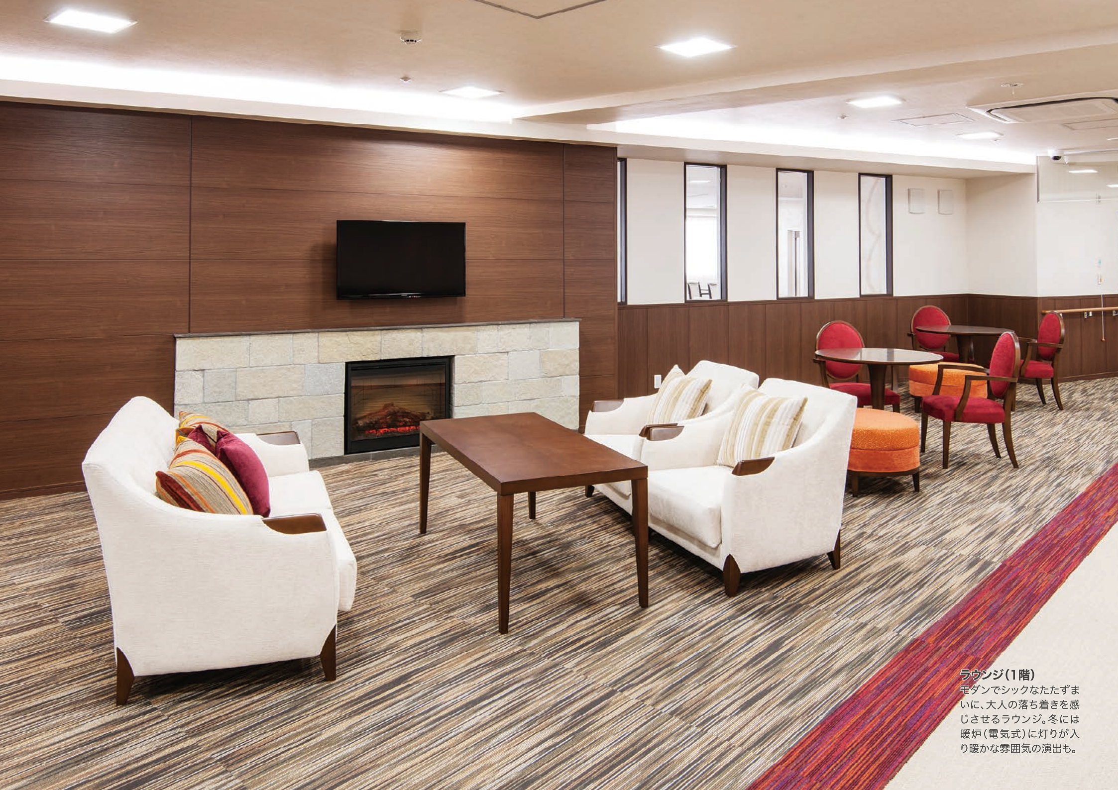
ラウンジ(1階) 電ダンでシックなたたずまいに、大人の落ち着きを感じさせるラウンジ。冬には暖炉(電気式)に灯りが入り暖かな雰囲気の演出も。