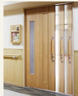
2 フリーストップ付き玄関扉