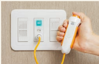
6 ケア・ナースコール