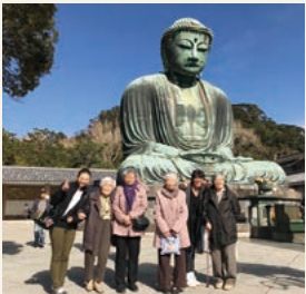
外出レクリエーション（鎌倉ツアー）の様子（令和元年11月撮影）

当ホームでは、お元気な方から介護度の高い方まで、より豊かな毎日を過ごしていただけるよう、日々のレクリエーションに加え、ご入居者様のお誕生会のほか、クリスマスやお正月などの季節の行事、パステルアートなどの趣味のレクリエーションを行っています。