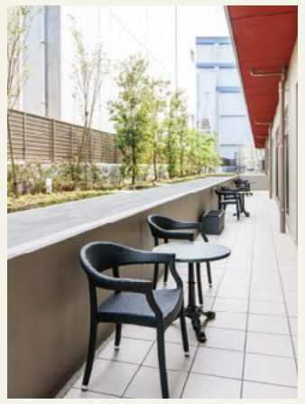
テラス 1階ダイニングルームに隣接した開放感溢れるテラス。お食事後にくつろげるスペースです。