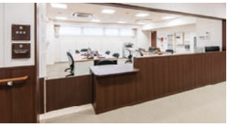
ヘルパーステーション（訪問介護事業所）

住宅型有料老人ホーム「ラヴィーレレジデンス橋本」には、同一建物内に24時間365日対応可能な訪問介護事業所及び訪問看護ステーションが併設されています。ご入居者様が介護・看護が必要となった場合、ご入居者様自身の選択により同一建物内に併設の事業所の介護・看護サービスを受けていただくことができます。さらに、居宅介護支援事業所を併設し、ご入居者様のケアプランの作成から介護に関する様々なご相談にも応じます。