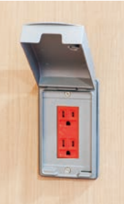
非常用コンセント（参考写真）

災害時に備え、食糧、介護用品、ヘルスケア用品など多種多様な備品を完備しています。