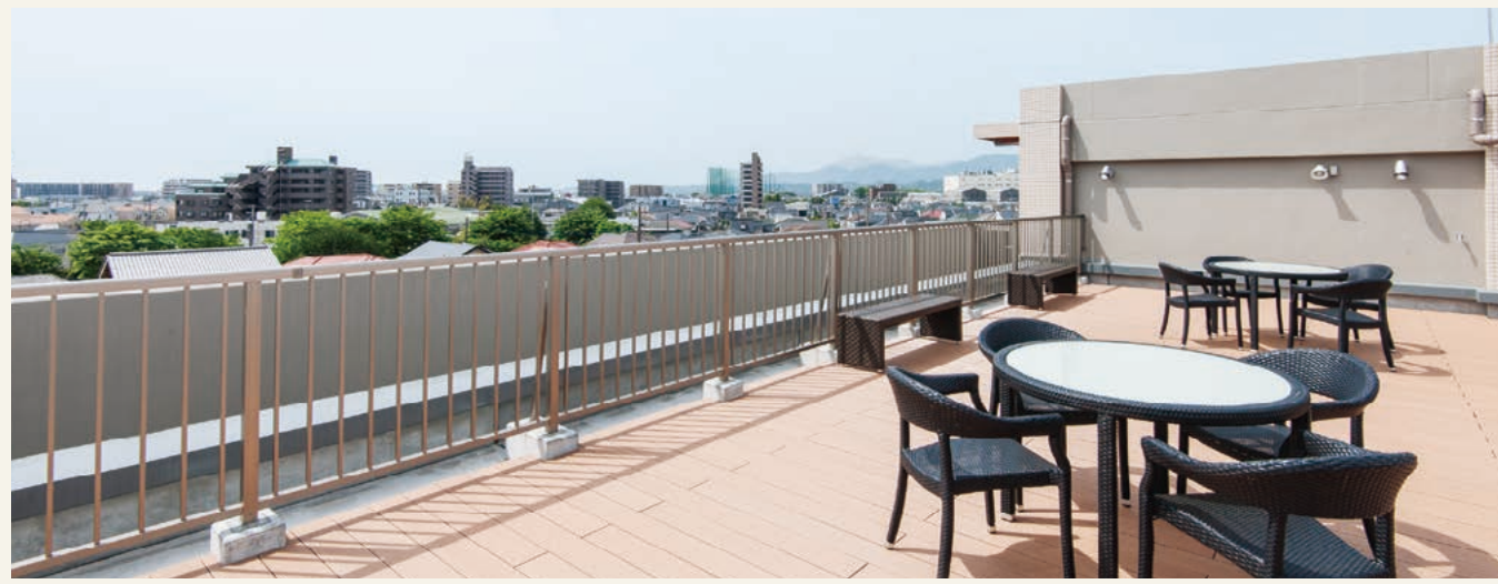
ルーフテラス 5階に設けられた開放的なルーフテラス。豊かな自然景観が望め、お天気の日には日光浴やご入居者様同士の語らいの場としてご利用いただけます。