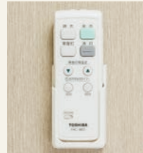
7 居室照明リモコン