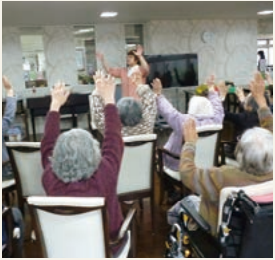
理学療法士（PT）による健康体操の様子（令和2年2月撮影）

スタッフによる介護度進行を予防するグループリハビリを導入。車いすの方でも参加していただける体操を通じて、健康維持と、より質の高い生活のためのサポートにも積極的に取り組んでいます。