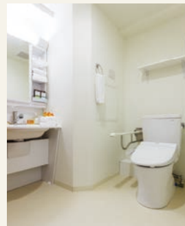
1 多機能トイレ&洗面台

ドレープカーテンとレースカーテン共に、万が一の際、炎が燃え広がるのを防ぐ防災タイプを採用しています。また、ドレープカーテンは遮光タイプでもあり、強い日差しを遮ってくれます。