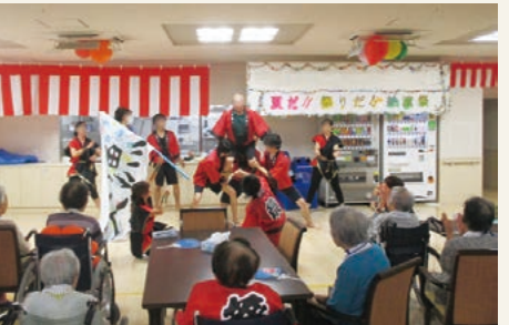
納涼祭の様子(平成26年8月撮影)

ご入居者様のお誕生会はもとより、手作り体験や書道、音楽鑑賞、健康づくりなど、毎月多種多様なレクリエーションを実施。日々の暮らしをさらにに楽しみたいだけるよう趣向を凝らしています。