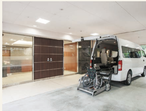
【エントランスアプローチ】

屋上階に設けられた開放的なルーフテラス。豊かな自然景観が望め、お天気の日には日光浴やご入居者様同士の語らいの場としてご利用いただけます。