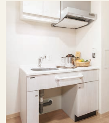
■ミニキッチン(D-Eタイプ) 二人部屋に、ミニキッチンを設置しました。また、安全に考慮し、卓上型のIHコンロを貸し出しでの対応としました。

プライバシー確保を第一に考え、お部屋はすべて個室をご用意しております。これまでお使いの家具や思い出の品をお持ちいただき、ご自分らしくお暮らしいただけます。洗面・トイレには人感センサー付照明やケア・ナースコールを設置するなど、安心して快適にお暮らしいただける居室づくりにこだわりました。