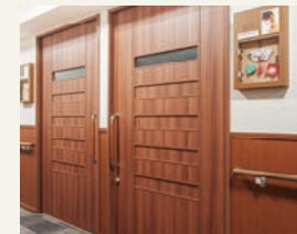
1 フリーストップ付き玄関扉