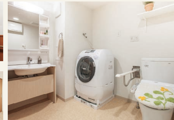
3 クローゼット 4 多機能トイレ&amp;洗面台