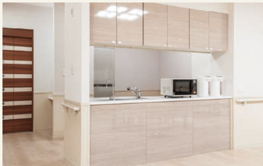
対面型システムキッチン

【ダイニングルーム】 ご入居者様全員が揃ってお食事いただける十分な広さを確保。通常の朝昼夕のお食事の時はもちろん、日々のレクリエーションや月ごとのイベントの際には、ご家族様も招いて一緒に楽しめるスペースです。