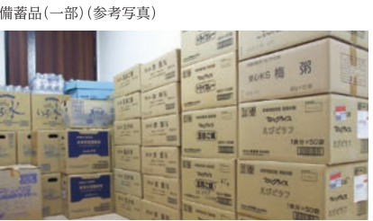
備蓄品(一部)(参考写真)