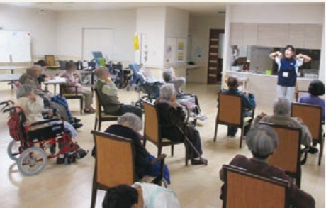
大手スポーツクラブの専門トレーナーによる介護予防体操の様子 (平成26年3月撮影)

スタッフによる介護度進行を予防するグループリハビリを導入。車いすの方でも参加していただける体操やゴムバンドを使ったセラバンド体操などを通じて、健康維持と、より質の高い生活のためのサポートにも積極的に取り組んでいます。