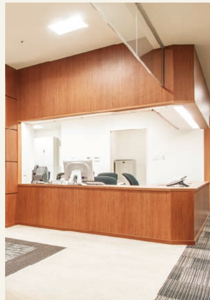
【ヘルパーステーション】