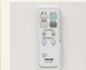
6 居室照明リモコン