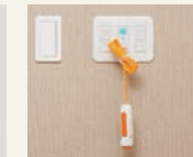
7 ケア・ナースコール