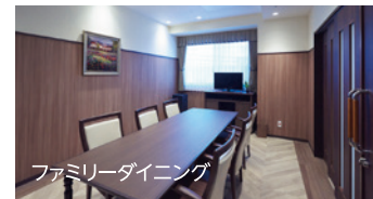
ファミリーダイニング