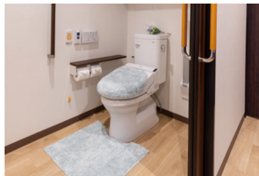
広々としたトイレを全室に設置