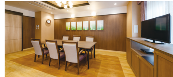
ご訪問されたご家族と和やかなひとときを過ごすファミリーダイニング