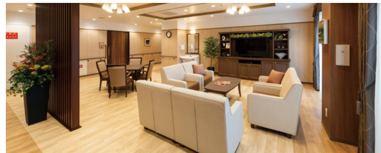
ご入居者さまに心地よくご使用いただける共用スペース

ゆったりとしたダイニング（食堂）や思い思いに過ごせるラウンジなど、 日常的にゆとりと癒しを実感できる共用空間・設備をご用意しています。