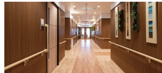
手すりを多く設置した広く明るい廊下