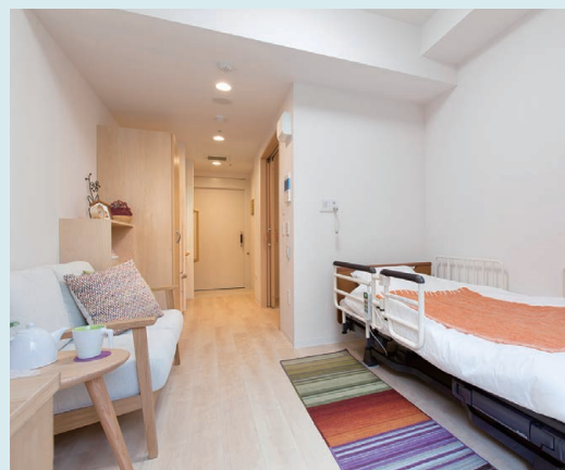
お好みの家具を持ち込むことができる住空間

開き戸の玄関がある居室は、さながらワンルームの賃貸マンション。シニアに優しい設備や機能も備わった、自由に安心して暮らせる“我が家”です。