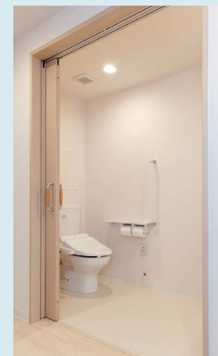
バリアフリー設計のゆとりあるトイレ