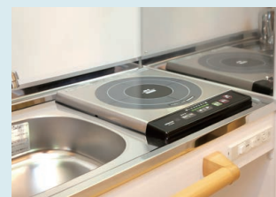
料理が楽しめるIHキッチン

※住戸タイプにより、形状・色調・設置位置等が異なる場合があります。また、掲載内容についても住戸タイプにより一部採用されていない場合があります。