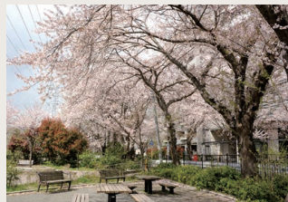
吉田第2公園 (徒歩約2分)