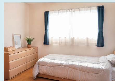
モデルルームの一例

ワンルームから、1DK・1LDK・2LDKと19タイプの多彩な間取りが選べます。広さも26㎡～55㎡とお一人さまからご夫婦などの入居が可能です。