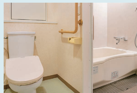
トイレ・浴室の一例