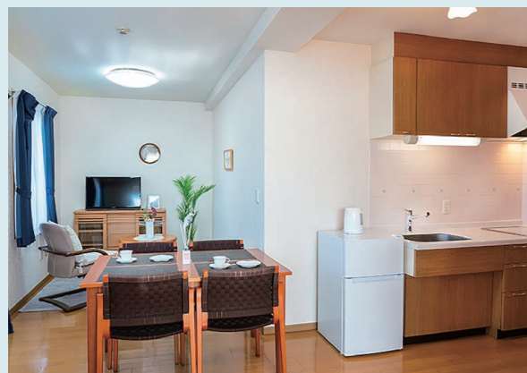
お好みの家具を持ち込むことができる住空間

ワンルームから、1DK・1LDK・2LDKと19タイプの多彩な間取りが選べます。広さも26㎡～55㎡とお一人さまからご夫婦などの入居が可能です。