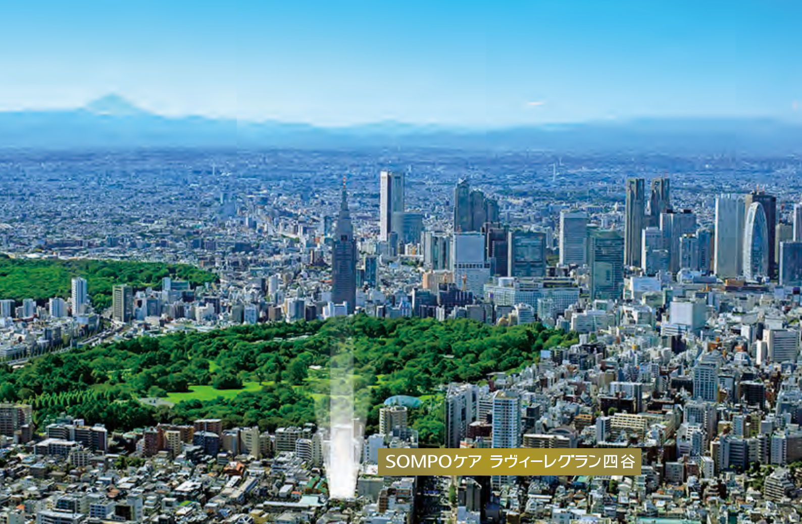
SOMPOケア ラヴィーレグラン四谷