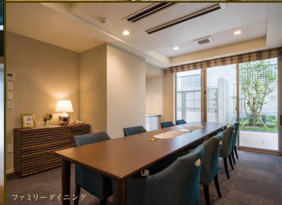
ファミリーダイニング