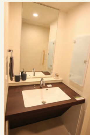
洗面台（温水） 車いすの方もご利用しやすい設計の洗面台です。