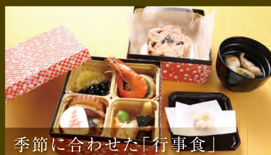
季節に合わせた「行事食」