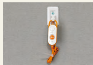
ナースコール ベッドの横に設置しているので、いざという時も安心です。