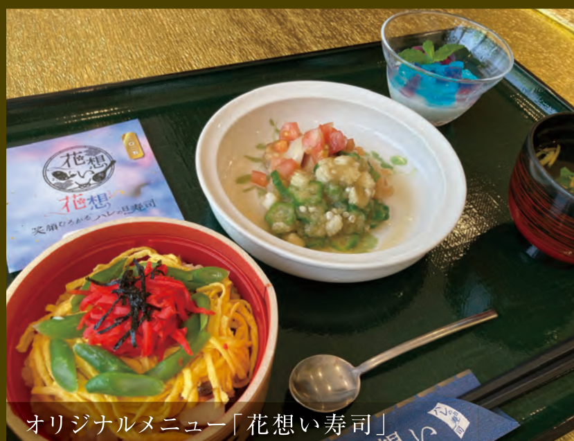
オリジナルメニュー「花想い寿司」