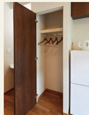
クローゼット 高さとお行きがあるので、収納力が豊富な物入。