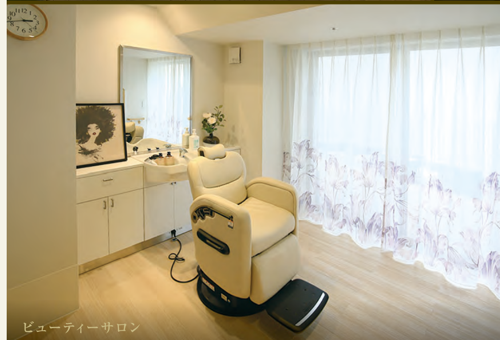
ビューティーサロン