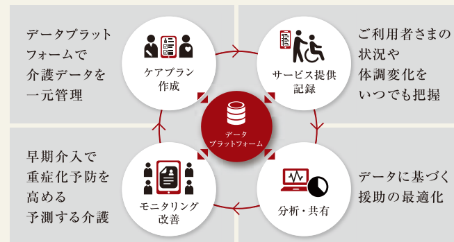
SOMPOケアのケアマネジメントサイクル

ご利用者さまの健康状態からスタッフの活動状況まで、あらゆる 情報をデータ化し集約。高品質なケアの提供やスタッフの業務負担 軽減のほか、ホーム・事業所運営の効率化を進めていきます。