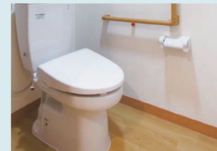
バリアフリー設計のゆとりあるトイレ