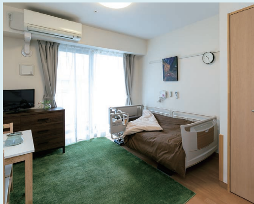
お好みの家具を持ち込むことができる住空間

開き戸の玄関がある居室は、さながらワンルームの賃貸マンション。シニアに優しい設備や機能も備わった、自由に安心して暮らせる“我が家”です。