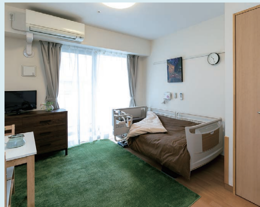
お好みの家具を持ち込むことができる住空間

開き戸の玄関がある居室は、さながらワンルームの賃貸マンション。シニアに優しい設備や機能も備わった、自由に安心して暮らせる“我が家”です。