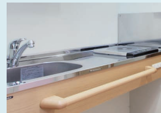
料理が楽しめるIHキッチン