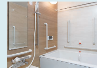
手すりが適切に付けられている浴室