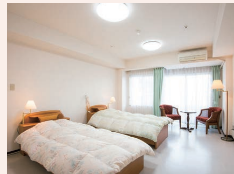
自分らしくのびのびと過ごせる居室

約35m 2 ～最大約48.6m 2 の広々とした居室で、すべてのお部屋で2名さままでのご入居が可能です。ご夫婦やご家族、自立の方もご入居いただけますので、今までのライフスタイルそのままにお過ごしいただけます。