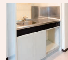
生活に便利なキッチン