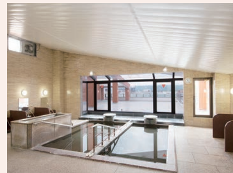
展望風呂「富士の湯」

四季の移ろいを感じられる大きな中庭や天気の良い日は遠くに富士山を眼下に望める展望風呂が魅力の「そんぼの家 羽村」。古き良き昭和の雰囲気漂う本館は、安らぎとくつろぎのひと時を提供できる多彩なスペースがあり、日々の暮らしを彩ります。