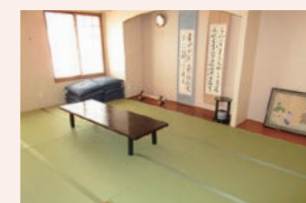
ご家族さま用の宿泊部屋（無料）

四季の移ろいを感じられる大きな中庭や天気の良い日は遠くに富士山を眼下に望める展望風呂が魅力の「そんぼの家 羽村」。古き良き昭和の雰囲気漂う本館は、安らぎとくつろぎのひと時を提供できる多彩なスペースがあり、日々の暮らしを彩ります。