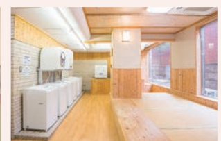
洗濯機6台乾燥機5台完備の洗濯室（無料）