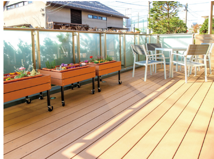
季節の草花で彩るウッドデッキテラス

ゆったりとしたダイニング（食堂）や、ウッドデッキテラスなど 日常的にゆとりと癒しを実感できる共用空間・設備をご用意しています。