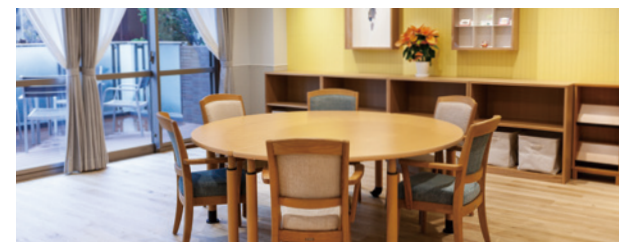
他のご入居者さまやスタッフとの会話が弾む円卓