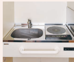
火を使わない安全なIHコンロを装備