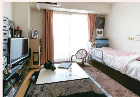
自分らしくのびのびと過ごせる居室

ご自宅で過ごすのと同じような環境づくりを大切にした個室仕様の“住まい”が、これまでと変わらないありのままで暮らす日々を叶えます。