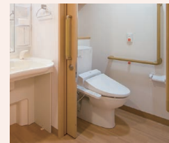
車椅子でも使いやすいトイレと洗面台