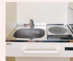
火を使わない安全なIHコンロを装備