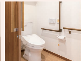
緊急通報装置がある 安全なトイレ