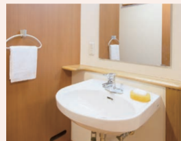
車椅子でも使いやすい 洗面台

※居室内の設備・配置および居間の広さ・形は、ホームによって異なる場合がございます。