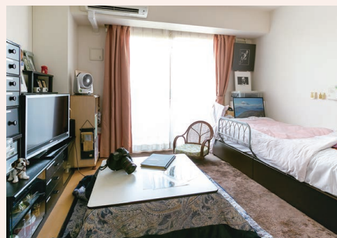
自分らしくのびのびと過ごせる居室

ご自宅で過ごすのと同じような環境づくりを大切にした個室仕様の“住まい”が、これまでと変わらないありのままで暮らす日々を叶えます。