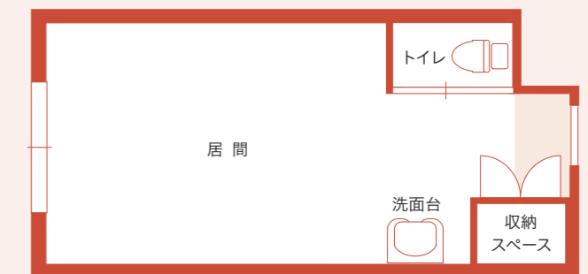
※居室内の設備・配置および居間の広さ・形は、ホームによって異なる場合がございます。