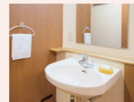
車椅子でも使いやすい洗面台