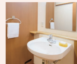
車椅子でも使いやすい 洗面台

※居室内の設備・配置および居間の広さ・形は、ホームによって異なる場合がございます。