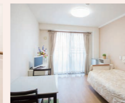
使い慣れた家具など お持ち込み可能な居室