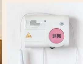
緊急通報装置もあって安心