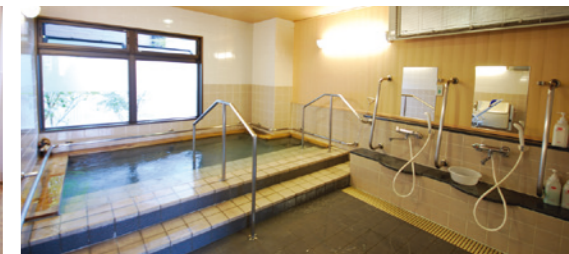
ゆったりとした気分で入れる大浴場