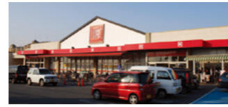
スーパーマツゲン