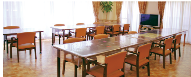
大きな窓から陽光が差し込む、明るさいっぱいダイニング

ゆったりとしたダイニング(食堂)や四季の移ろいを感じられる庭など、 日常的にゆとりと癒しを実感できる共用空間・設備をご用意しています。