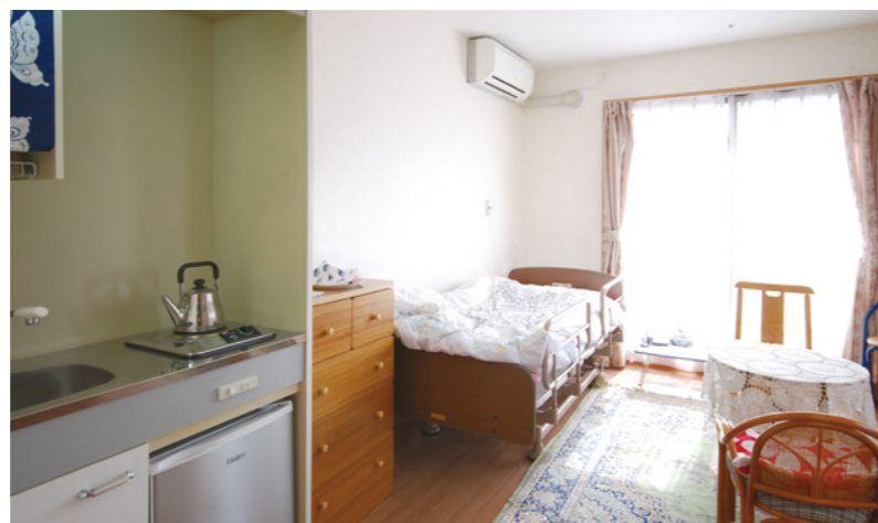
お気に入りの家具を持ち込める居室 (モデルルーム)