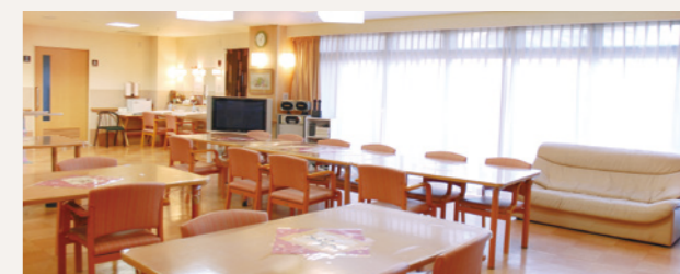
SOMPOケア ハッピーデイズ岸和田 デイルーム

介護が必要な方は、1Fに併設しているデイサービスや訪問介護をご利用いただき、介護サービスを受けることができます(ご希望により、他の訪問介護サービス事業所等との契約も可能です)。また、併設している訪問看護は緊急時訪問看護加算が利用できますので緊急事態にも対応可能です。ホーム近くのクリニックの訪問診療を受けることもできます。