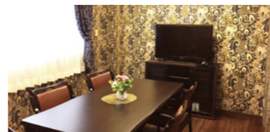
明るく華やかな雰囲気相談室