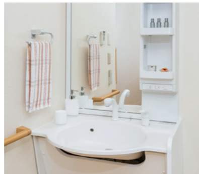
清潔感のある洗面化粧台を各居室に設置