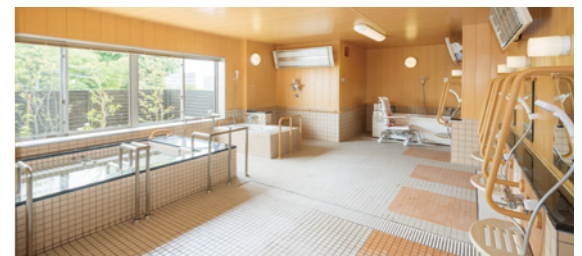
坪庭を眺めながら温泉気分に入れる浴室