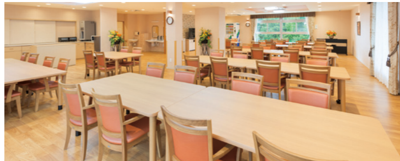
大きな窓から陽光が差し込む明るいダイニング

ゆったりとしたダイニング（食堂）や思い思いに過ごせるスペースをホーム各所に配置。 日常的にゆとりと癒しを実感できる共用空間・設備をご用意しています。