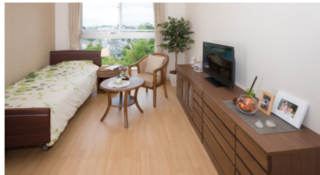
お気に入りの家具を持ち込める居室（モデルルーム）

毎日、快適にお過ごしいただくために、広々と使える居室をご用意。各室には、緊急コールを設置。安心・安全にも徹底的に配慮しています。