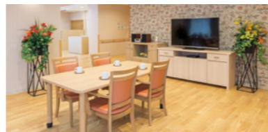
ダイニング内の団楽スペース