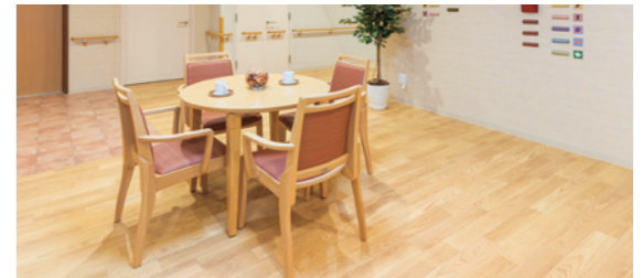
日々のリハビリやご入居者さまどうしの会話も弾む多目的スペース