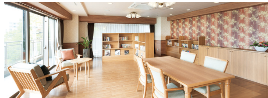
自由に読書を楽しめるラウンジ

ゆとりと癒しに満ちた共用空間・設備をご用意。広々としたダイニング（食堂）、知的好奇心を満たす様々な本が揃ったラウンジ、ゆったりと過ごせるカフェなど充実しています。