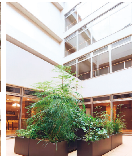
日射しが心地よい吹き抜けの中庭