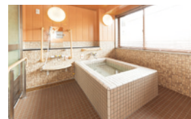
ゆったりとした気分で入れるお風呂