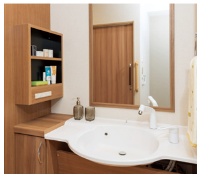
清潔感のある洗面化粧台を各居室に設置