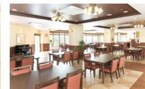
大きな窓に面し明るさいっぱいダイニング