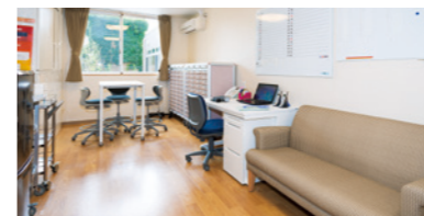
ご入居者さまの健康をサポートする 健康管理室