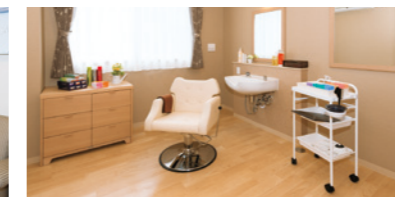
いつまでも美しくいていただくための 理美容室