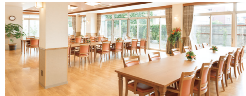
大きな窓から陽光が差し込む明るいダイニング

窓の大きなダイニング(食堂)やお散歩や日光浴をお楽しみいただける中庭をはじめ、 日常的にゆとりと癒しを実感できる共用空間・設備をご用意しています。