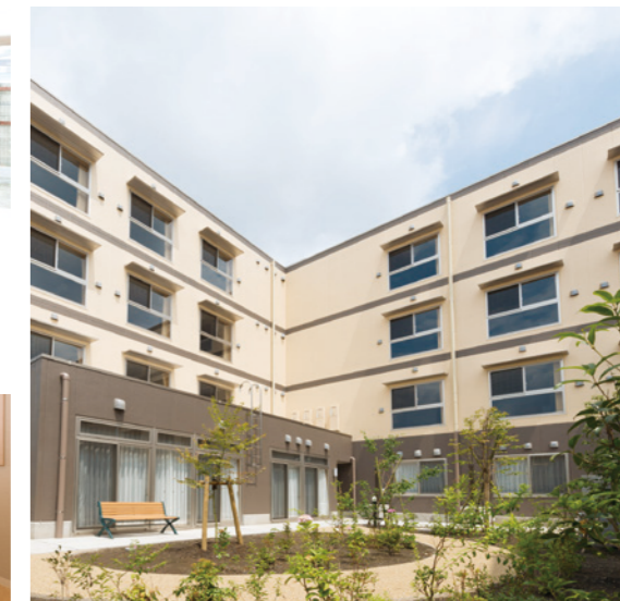
季節を美しく映す中庭