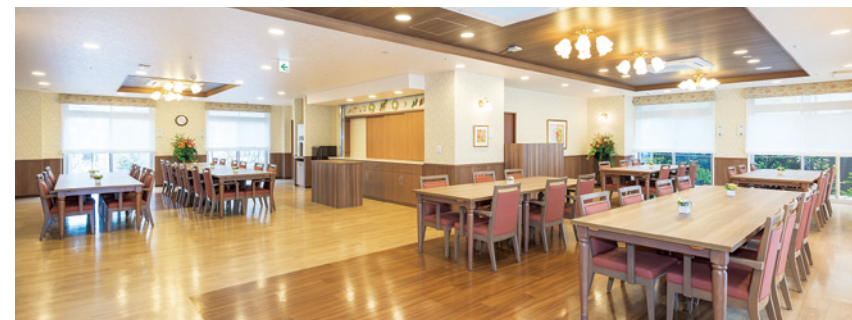
光射しこみ明るさいっぱいのダイニング

広々としたダイニングや思い思いに過ごせるカフェなど、自然と会話が生まれる、居心地の良い共用スペースをご用意。 ホームにいながら、大きな窓から光や風などの自然を感じていただけるよう工夫しています。