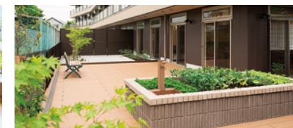
農園を備えたウッドデッキテラス