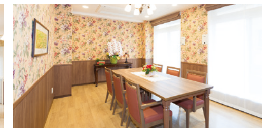
ファミリーダイニング