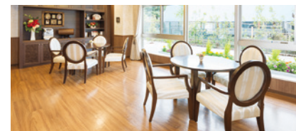
コーヒーを飲みながら楽しめるカフェ