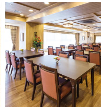
大きな窓から陽光が差し込む 明るさいっぱいダイニング