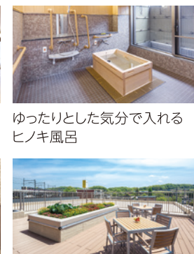
ゆったりとした気分で入れる ヒノキ風呂