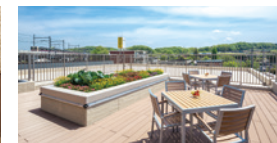
農園もある広々とした 屋上テラス