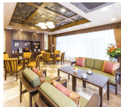
落ち着いた雰囲気で心地よいカフェ

ゆったりとしたダイニング(食堂)や思い思いに過ごせるカフェなど、 日常的にゆとりと癒しを実感できる共用空間・設備をご用意しています。