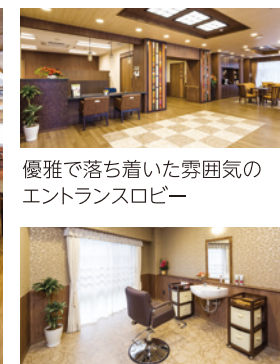
優雅で落ち着いた雰囲気 のエントランスロビー