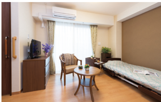
居室（横向き／モデルルーム）