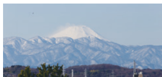
4階からの富士山の眺望