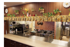
できたてのおいしい料理を 調理するオープンキッチン