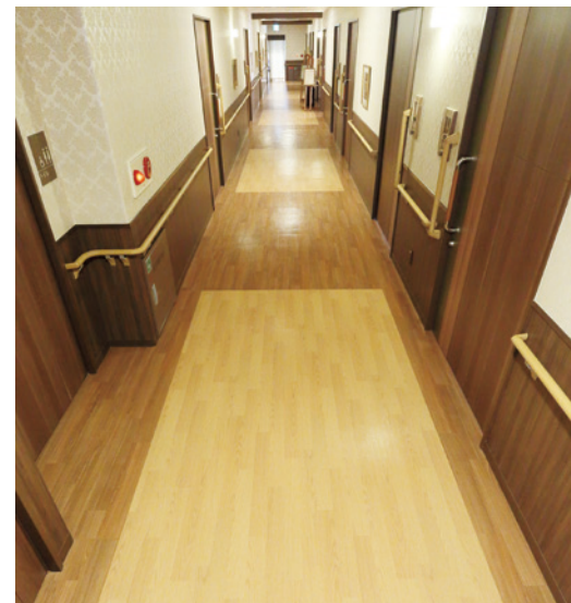
床面には3mおきに印があり、歩行リハビリの目安になります。