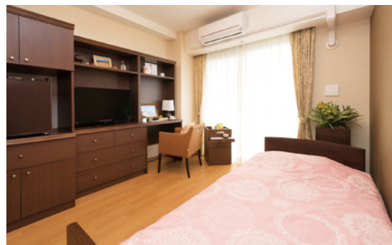
お気に入りの家具を持ち込める居室（縦向き／モデルルーム）

お好みの居室を選ぶことができ、ご自分らしい生活をお楽しみいただけます。また、各室に緊急コールを設置し、安心・安全に配慮しています。