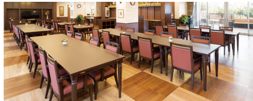
大きな窓から陽光が差し込む明るさいっぱいのダイニング

ゆったりとしたダイニング（食堂）や思い思いに過ごせるカフェなど、 日常的にゆとりと癒しを実感できる共用空間・設備をご用意しています。