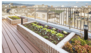
花や野菜を育てる農園