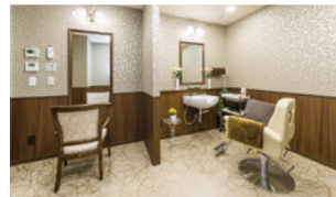
いつまでも美しくいていただくための理美容室