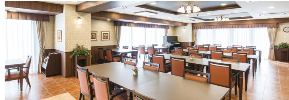
大きな窓から陽光が差し込む明るいダイニング

ゆったりとしたダイニング(食堂)や思い思いに過ごせるカフェなど、 日常的にゆとりと癒しを実感できる共用空間・設備をご用意しています。