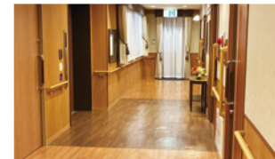
広々とした廊下が、日々の安心を支えます