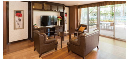
ご入居者さまに心地よくお過ごしいただける共用スペース