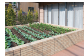
花や野菜を育てる農園