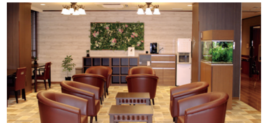
エントランス横のカフェスペース