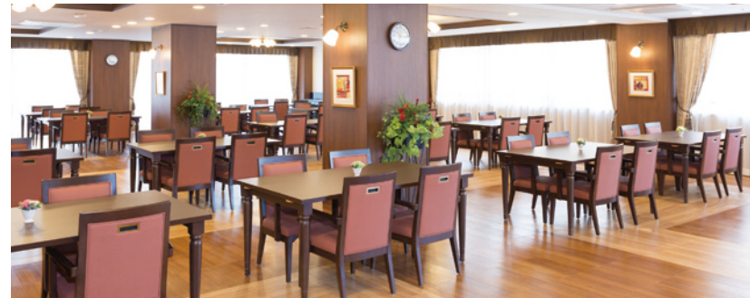
大きな窓から陽光が差し込む明るいダイニング

ゆったりとしたダイニング（食堂）や思い思いに過ごせるカフェなど、 日常的にゆとりと癒しを実感できる共用空間・設備をご用意しています。