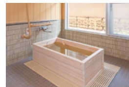
ゆったりとした気分で入れる ヒノキ風呂