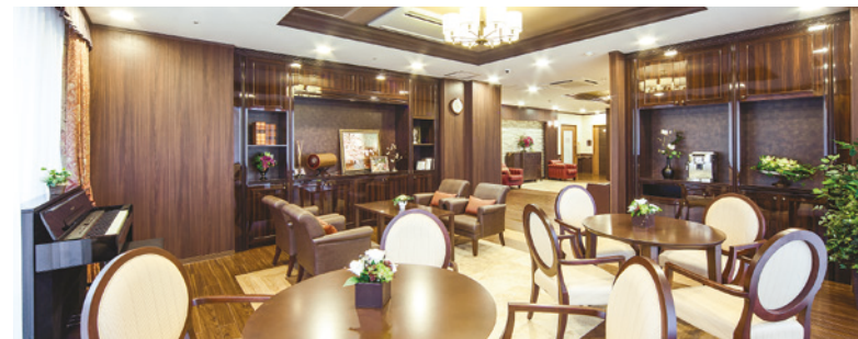
思い思いにお過ごしいただけるカフェ

ゆったりとしたダイニング（食堂）や思い思いに過ごせるカフェなど、日常的にゆとりと癒しを実感できる共用空間・設備をご用意しています。