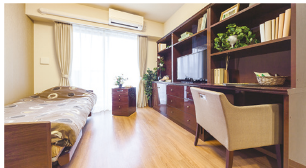
お気に入りの家具を持ち込める居室（モデルルーム）

安心してお過ごしいただけるよう、緊急コールを各室とトイレに設置し、車椅子のご利用にも配慮しています。