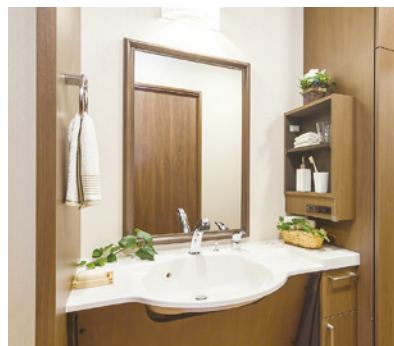
清潔感のある洗面化粧台を各室に設置