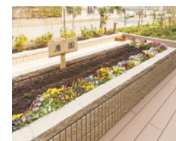
花や野菜を育てる農園