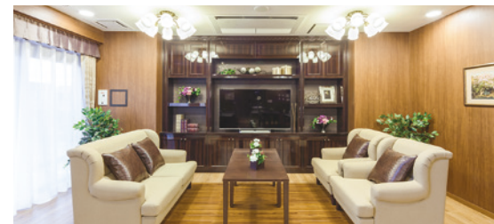
ご入居者さまに心地よく過ごしいただける共用スペース