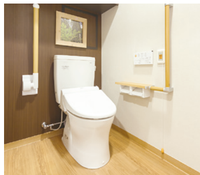
車椅子でも使いやすいトイレ