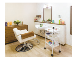
いつまでも美しくいていただくための理美容室