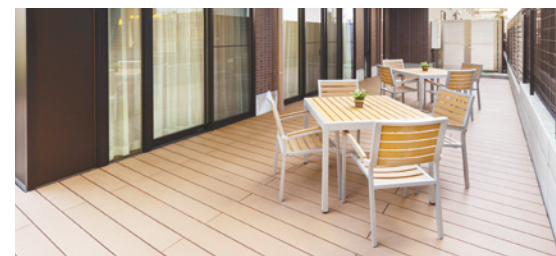
陽当たりがよく開放感あふれるウッドデッキテラス