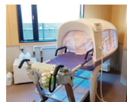
横になったままでもゆったり入浴ができる浴槽