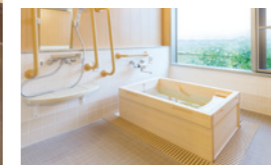
ゆったりとした気分で入れる ヒノキ風呂