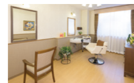
いつまでも美しくいていただく ための理美容室