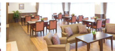
大きな窓から陽光が差し込む明るいダイニング