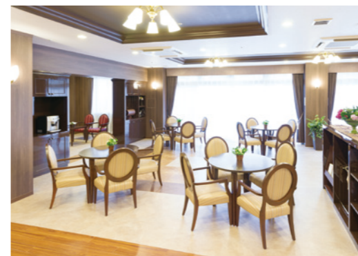
歓談をお楽しみいただけるカフェなど、ご入居者さまに 心地よくお過ごしいただける共用スペース

ゆったりとしたダイニング（食堂）や思い思いに過ごせるカフェなど、 日常的にゆとりと癒しを実感できる共用空間・設備をご用意しています。