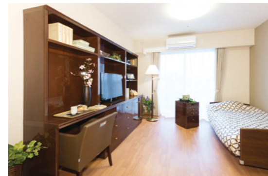
居室（モデルルーム） ※居室変更については、「入居についてのご案内」の「居室変更」欄に記載があります。

安心してお過ごしいただけるよう、緊急コールを各室、トイレに設置し、車椅子の利用にも配慮しています。