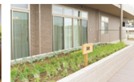
花や野菜を育てる農園