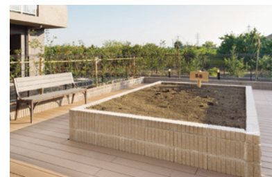
花や野菜を育てる農園