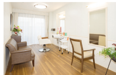
いつまでも美しくいていただく ための理美容室