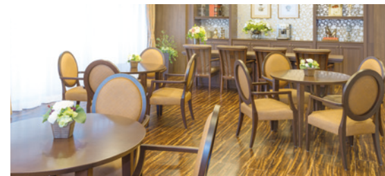
思い思いにお過ごしいただけるカフェ