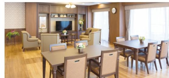
ご入居者さまの憩いの場となるラウンジ