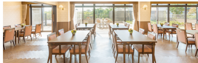
大きな窓に面し明るさいっぱいのダイニング

ゆったりとしたダイニング（食堂）や思い思いに過ごせるカフェなど、 日常的にゆとりと癒しを実感できる共用空間・設備をご用意しています。