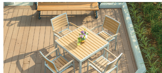
ご入居者さま同士での会話やティータイム、読書などを楽しめる開放感いっぱいのウッドデッキテラス