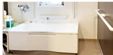
ゆったりとした気分で入れる個人浴