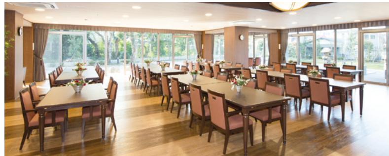
ひろびろとしたダイニングなど、ご入居者さまに心地よくご利用いただける共用スペース

窓の大きなダイニング（食堂）や各階に設けたラウンジをはじめ、日常的にゆとりと癒しを実感できる共用空間・設備をご用意しています。