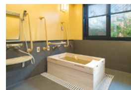
ゆったりとした気分で入れる ヒノキ風呂