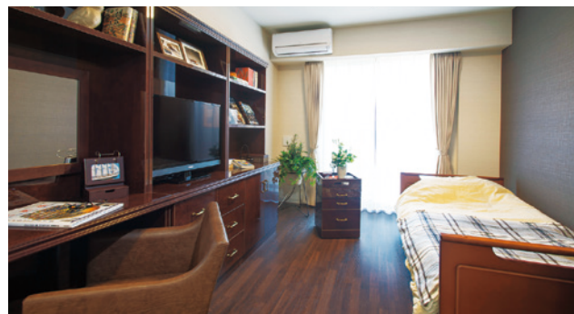
お気に入りの家具を持ち込める居室（モデルルーム）

安心してお過ごしいただけるよう、緊急コールを各室とトイレに設置し、車椅子のご利用にも配慮しています。