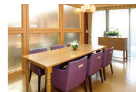
訪問されたご家族と和やかなひととき を過ごせるファミリーダイニング