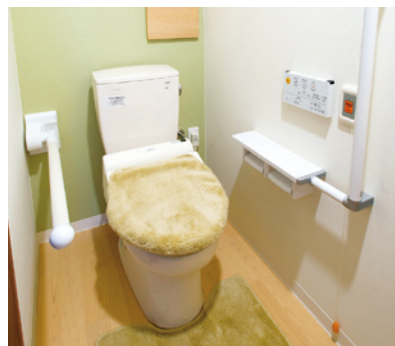
車椅子でも使いやすいトイレ