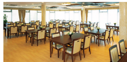
大きな窓から陽光が差し込む、明るさいっぱいダイニング