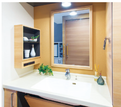
清潔感のある洗面化粧台を各室に設置