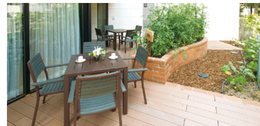
陽光やそよ風が気持ちよいテラス