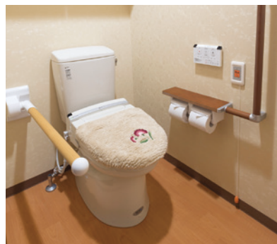
車椅子でも使いやすいトイレ