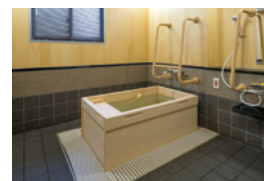
ゆったりとした気分で入れる ヒノキ風呂