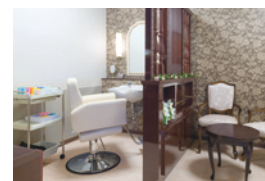
いつまでも美しくいていただく ための理美容室