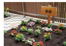
花や野菜を育てる農園