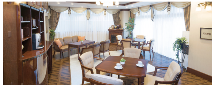
落ち着いたカフェをはじめご入居者さまに心地よくお過ごしいただける共用スペース

ゆったりとしたダイニング（食堂）や思い思いに過ごせるカフェなど、 日常的にゆとりと癒しを実感できる共用空間・設備をご用意しています。