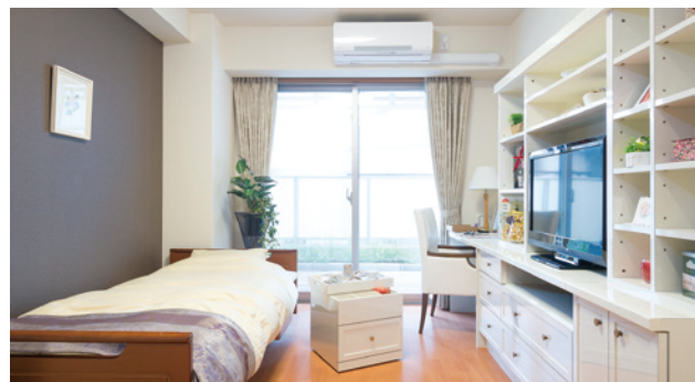
お気に入りの家具を持ち込める居室（モデルルーム）

安心してお過ごしいただけるよう、緊急コールを各室とトイレに設置し、車椅子のご利用にも配慮しています。