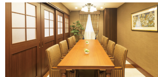
訪問されたご家族と和やかなひとときを過ごす ファミリーダイニング