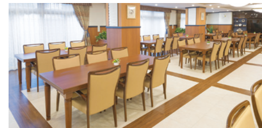
大きな窓から陽光が差し込む、明るさいっぱいダイニング