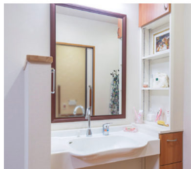
清潔感のある洗面化粧台を各室に設置