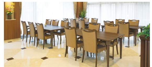
大きな窓に面し明るさいっぱいのダイニング