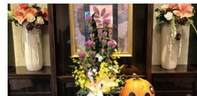
毎月変わる季節の生花