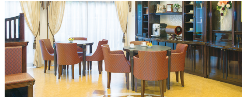
落ち着いたカフェをはじめご入居者さまに心地よくお過ごしいただける共用スペース

ゆったりとしたダイニング(食堂)や思い思いに過ごせるカフェなど、日常的にゆとりと癒しを実感できる共用空間・設備をご用意しています。