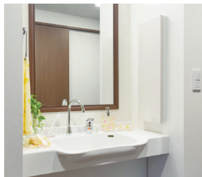
清潔感のある洗面化粧台を各室に設置