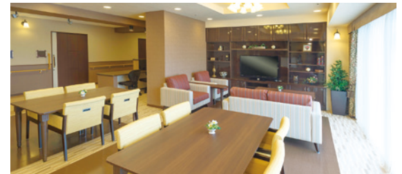
ご入居者さまの憩いの場となるラウンジ