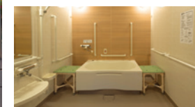
ゆったりとご入浴いただける浴室（個浴）