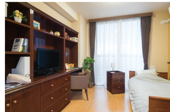
居室（モデルルーム） ※居室変更については、「入居についてのご案内」の「居室変更」欄に記載があります。

安心してお過ごしいただけるよう、緊急コールを各室、トイレに設置し、車椅子の利用にも配慮しています。