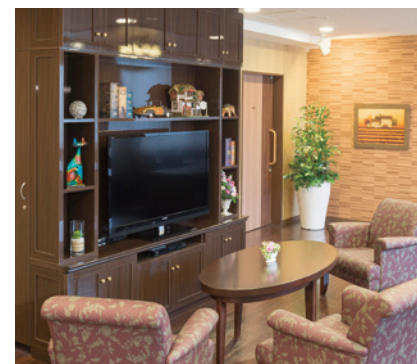
落ち着いたラウンジをはじめご入居者さまに 心地よくお過ごしいただける共用スペース

ゆったりとしたダイニング（食堂）や思い思いに過ごせるカフェなど、 日常的にゆとりと癒しを実感できる共用空間・設備をご用意しています。