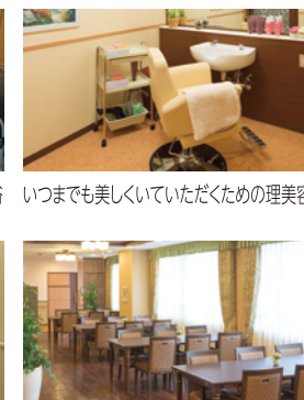
いつまでも美しくいていただくための理美容室