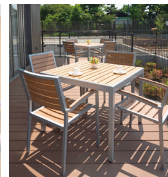
陽当たりがよく開放感あふれる ウッドデッキテラス