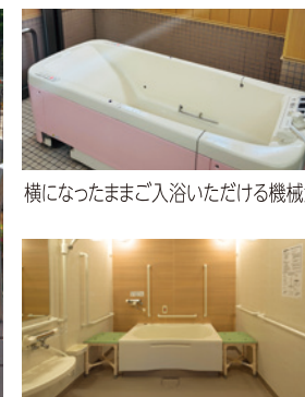
横になつたままご入浴いただける機械浴