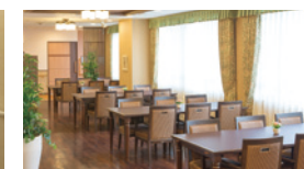
大きな窓に面し明るさいっぱいダイニング