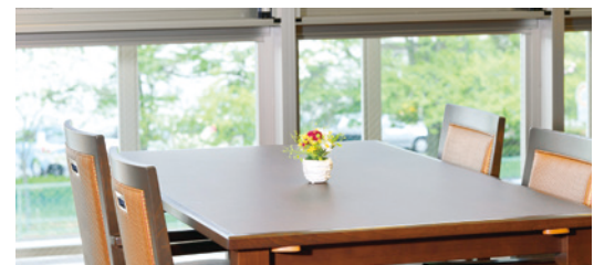
窓の外に広がる豊かな緑も楽しめるダイニング