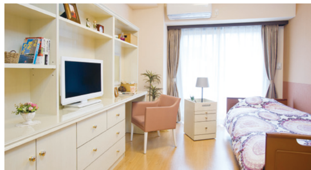
お気に入りの家具を持ち込める居室（モデルルーム）

安心してお過ごしいただけるよう、緊急コールを各室とトイレに設置し、車椅子のご利用にも配慮しています。