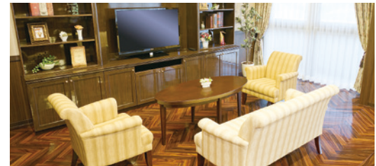
落ち着いたラウンジをはじめご入居者さまに心地よく お過ごしいただける共用スペース