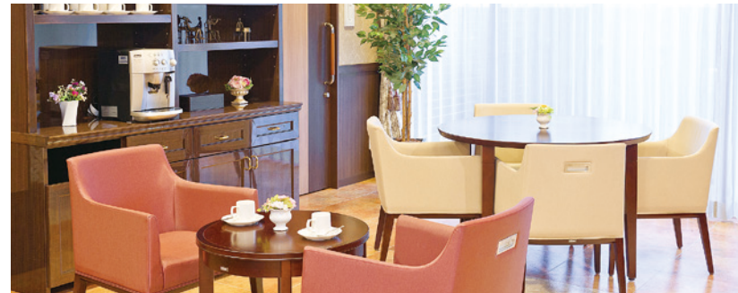
思い思いにお過ごしいただけるカフェ

各階に設けたダイニング（食堂）や思い思いに過ごせるカフェなど、 日常的にゆとりと癒しを実感できる共用空間・設備をご用意しています。