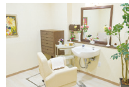
いつまでも美しくいていただく ための理美容室