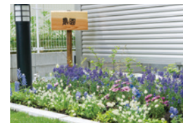
花や野菜を育てる農園