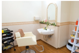
いつまでも美しくいていただく ための理美容室