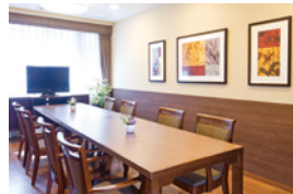
明るく落ち着いた雰囲気 の相談室