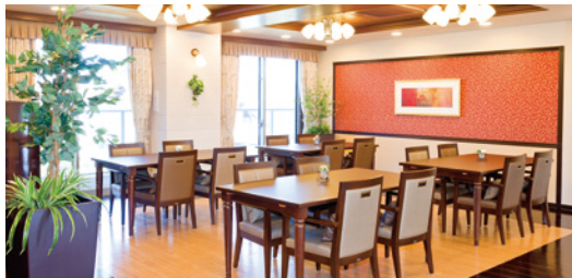
大きな窓に面し明るさいっぱいのダイニング（3F）