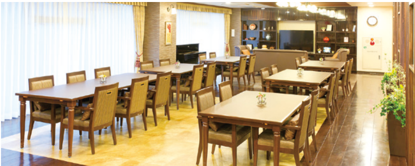
開放的なダイニング（2F）をはじめご入居者さまに心地よくお過ごしいただける共用スペース

各階に設けたダイニング（食堂）や思い思いに過ごせるカフェなど、 日常的にゆとりと癒しを実感できる共用空間・設備をご用意しています。