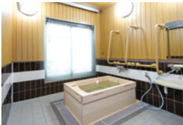
ゆったりとした気分で入れる ヒノキ風呂