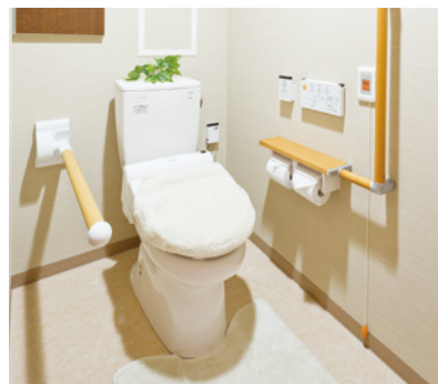
車椅子でも使いやすいトイレ