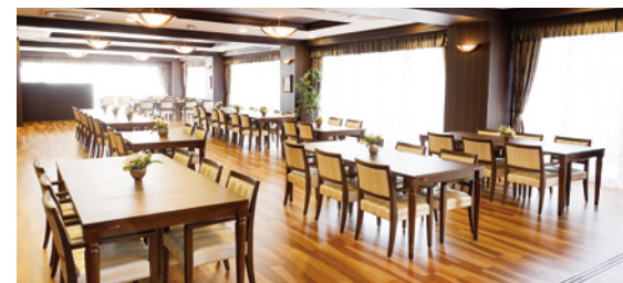
大きな窓に面し明るさいっぱいダイニング(食堂)