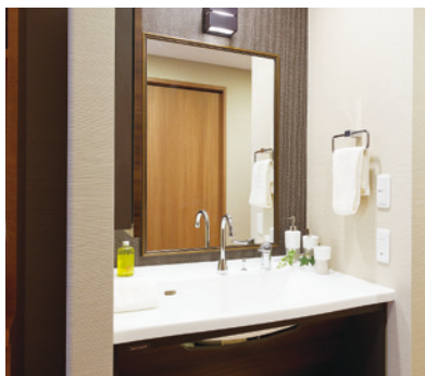
清潔感のある洗面化粧台を各室に設置