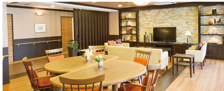
ご入居者さまの憩いの場となるラウンジ

窓の大きなダイニング(食堂)や各階に設けたラウンジをはじめ、 日常的にゆとりと癒しを実感できる共用空間・設備をご用意しています。