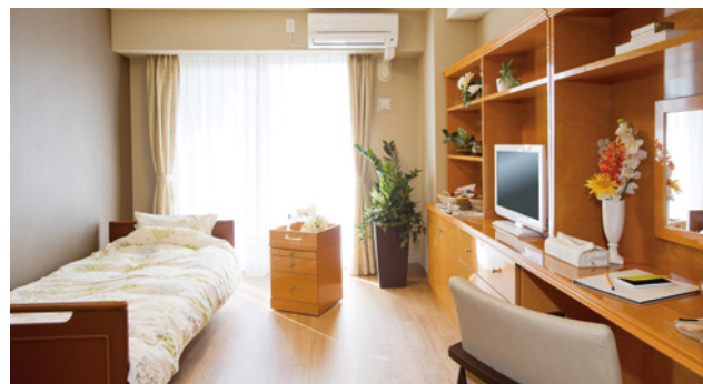
お気に入りの家具を持ち込める居室（モデルルーム）

安心してお過ごしいただけるよう、緊急コールを各室とトイレに設置し、車椅子のご利用にも配慮しています。