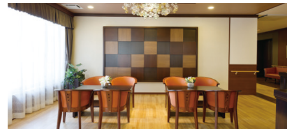
思い思いにお過ごしいただけるカフェ