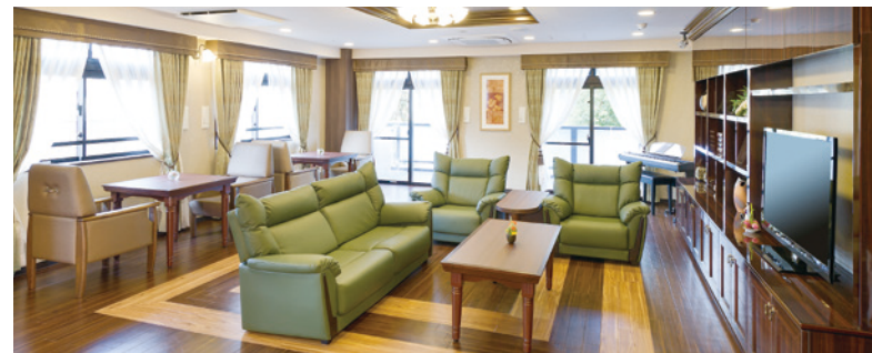
開放的なラウンジをはじめご入居者さまに心地よくお過ごしいただける共用スペース

窓の大きなダイニング（食堂）や各階に設けたラウンジをはじめ、 日常的にゆとりと癒しを実感できる共用空間・設備をご用意しています。