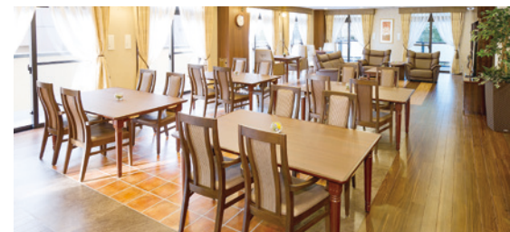
大きな窓から陽光が差し込む明るさいっぱいのダイニング（食堂）