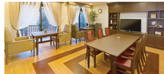
思い思いにお過ごしいただけるラウンジ