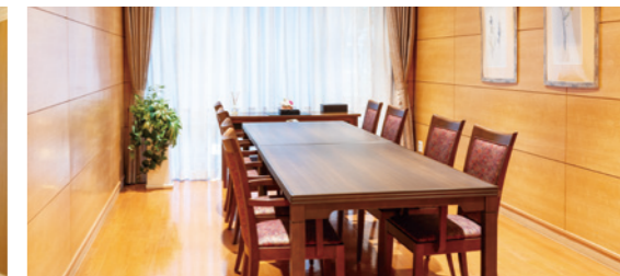
ご家族さまがいらしたときに使用できる応接室