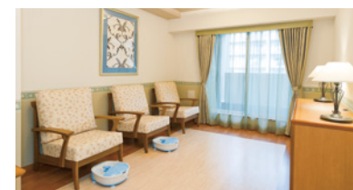
リラックスしていただくためのコーナーをご用意