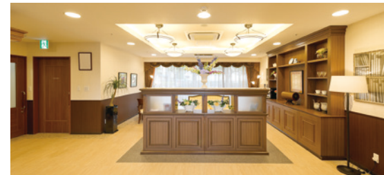
ご入居者さまや訪問されたご家族をゆったりと迎え入れる エントランスロビー