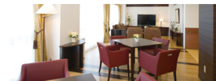
共用スペースでは、ご入居者さま同士での会話や 読書などをお楽しみいただけます。