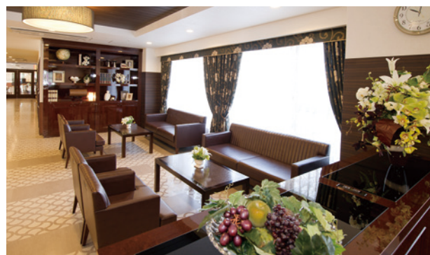
開放的なラウンジをはじめご入居者さまに心地よく お過ごしいただける共用スペース

ゆったりとしたダイニング（食堂）や思い思いに過ごせるカフェなど、 日常的にゆとりと癒しを実感できる共用空間・設備をご用意しています。