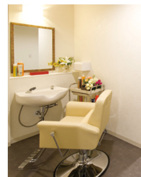
いつでも美しくいて いただくための理美容室