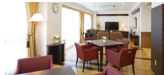
共用スペースでは、ご入居者さま同士での会話や読書などをお楽しみいただけます。