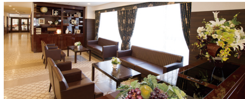
開放的なラウンジをはじめご入居者さまに心地よく過ごしいただける共用スペース

ゆったりとしたダイニング（食堂）や思い思いに過ごせるカフェなど、 日常的にゆとりと癒しを実感できる共用空間・設備をご用意しています。