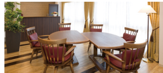
ご入居者さまの憩いの場となるラウンジ