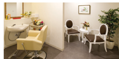
いつまでも美しくいていただくための理美容室