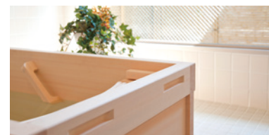
ゆったりとした気分で入れるヒノキ風呂